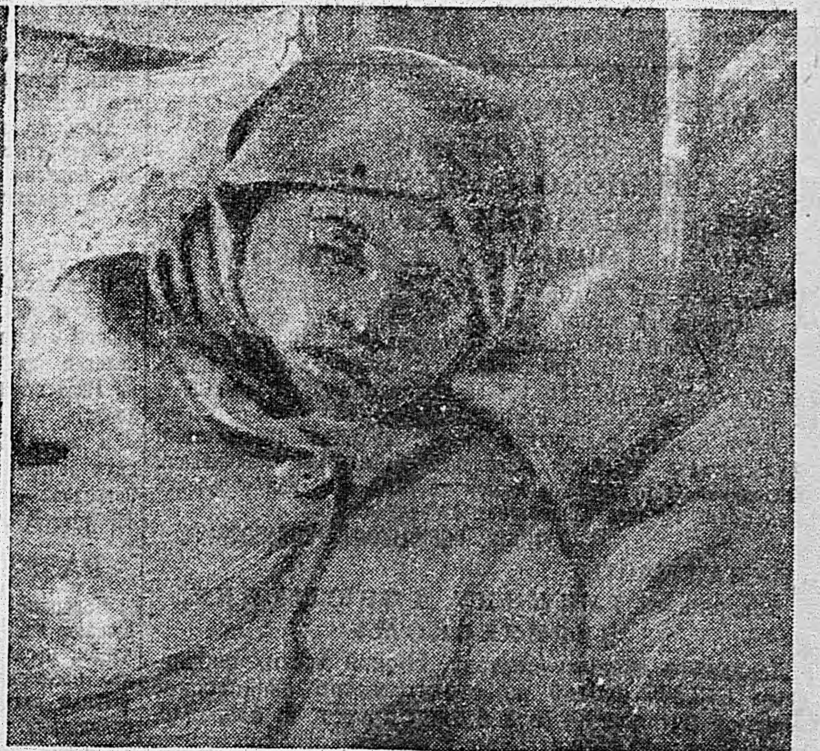
Трупы убитых фашистами женщин и детей, обнаруженные в доме Палова по улице Воровского № 47 в городе Ржеве.