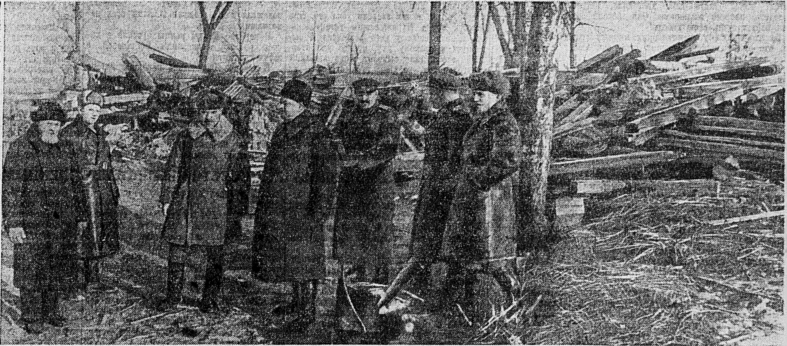
Председатель Чрезвычайной Государственной Комиссии Н. М. Шверник (4-й слева) и член Чрезвычайной Государственной Комиссии Николай, Митрополит Киевский и Галицкий (1-й слева) у разрушенной немецко-фашистскими захватчиками Кладбищенской церкви в городе Сычевке.