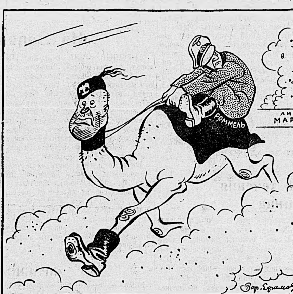
Рысистые бега в Африке.

Обычная скорость быстроходных верблюдов в Северной Африке — 10—12 км. в час. На специальных пробегах верблюды этой породы достигают скорости 23,5 км. в час. (Браз). Рис. Бор. Ефимова.