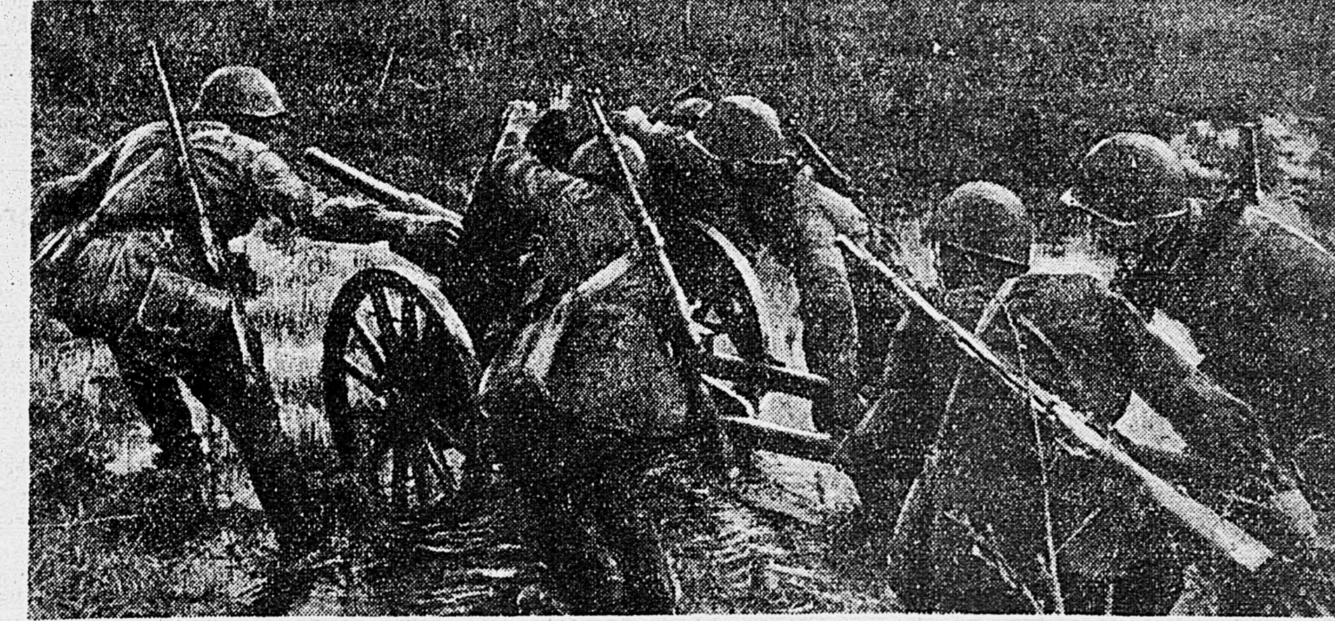
СЕВЕРО-ЗАПАДНЫЙ ФРОНТ. Расчет противотанковой пушки меняет огневую позицию.