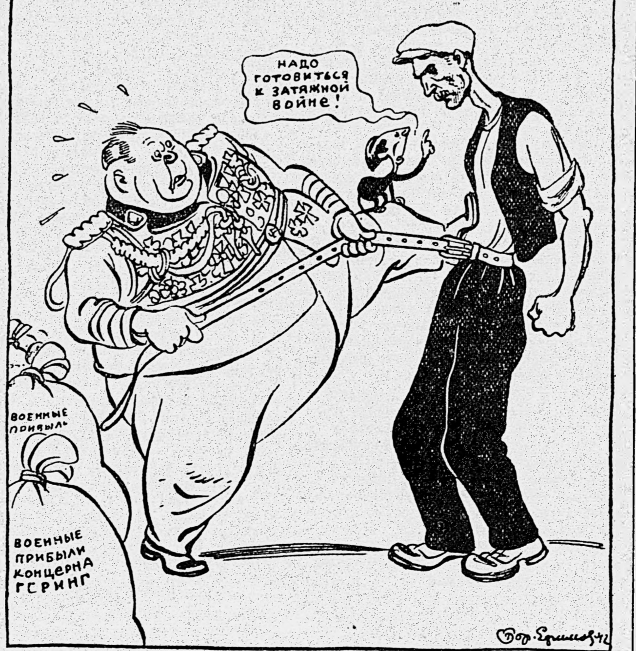
Рис. Бор. Ефимова.