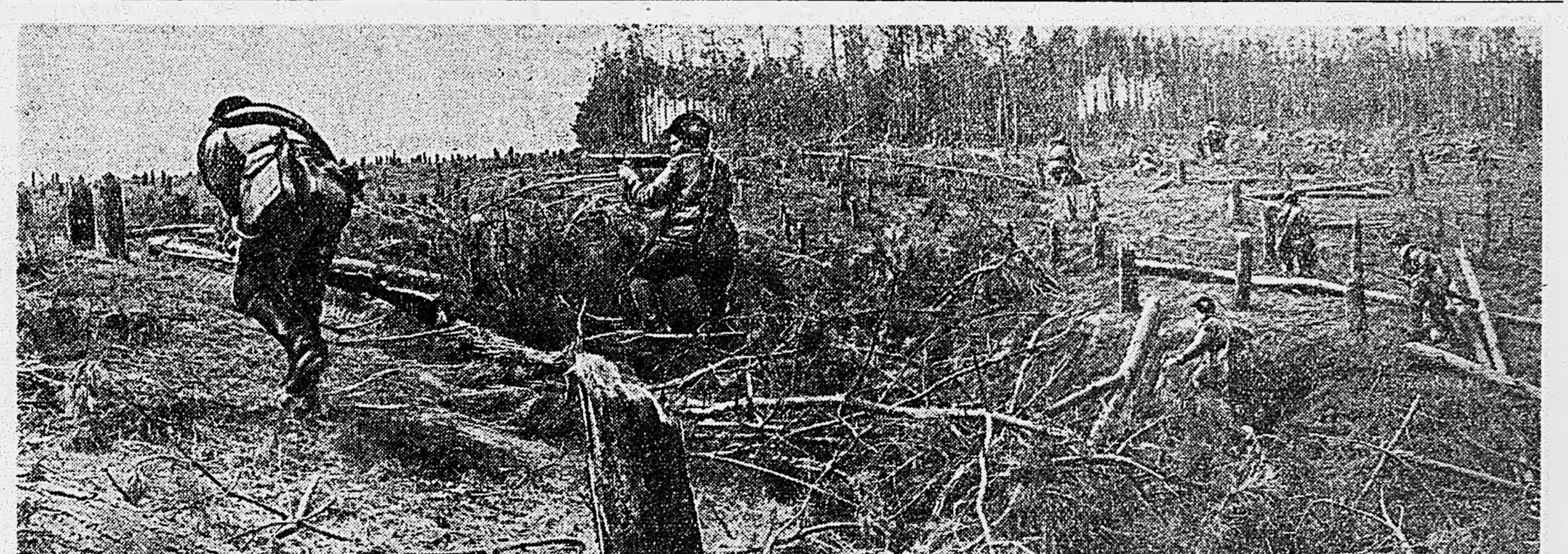
ЮГО-ЗАПАДНЫЙ ФРОНТ. Бойцы Н-ской части выдвигаются на новый рубеж.

ДЕЙСТВУЮЩАЯ АРМИЯ, 29 мая. (По телеграфу от наш. корр.). Прорвавшись в глубину вражеской обороны, наша часть наносит врагу чувствительные удары.