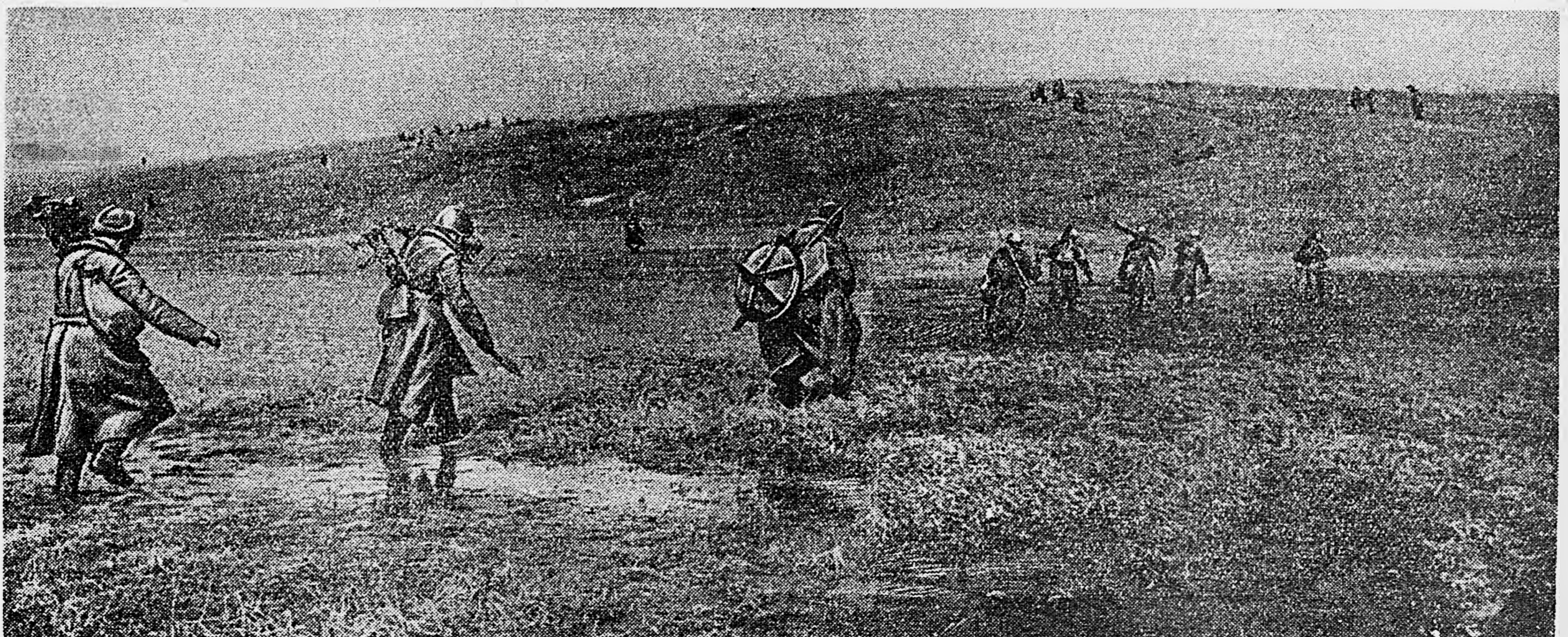
ЮГО-ЗАПАДНЫЙ ФРОНТ. Бойцы Н-ской части рассредоточенным строем переходят на новый рубеж.

Трофейное оружие немедленно приступить в ремонт. В оружейной мастерской отремонтировано 9 пушек, 96 пулеметов, 24 миномета, 7 переломов к орудиям, 9 полевых кухонь, свыше 3.000 выстрелов.