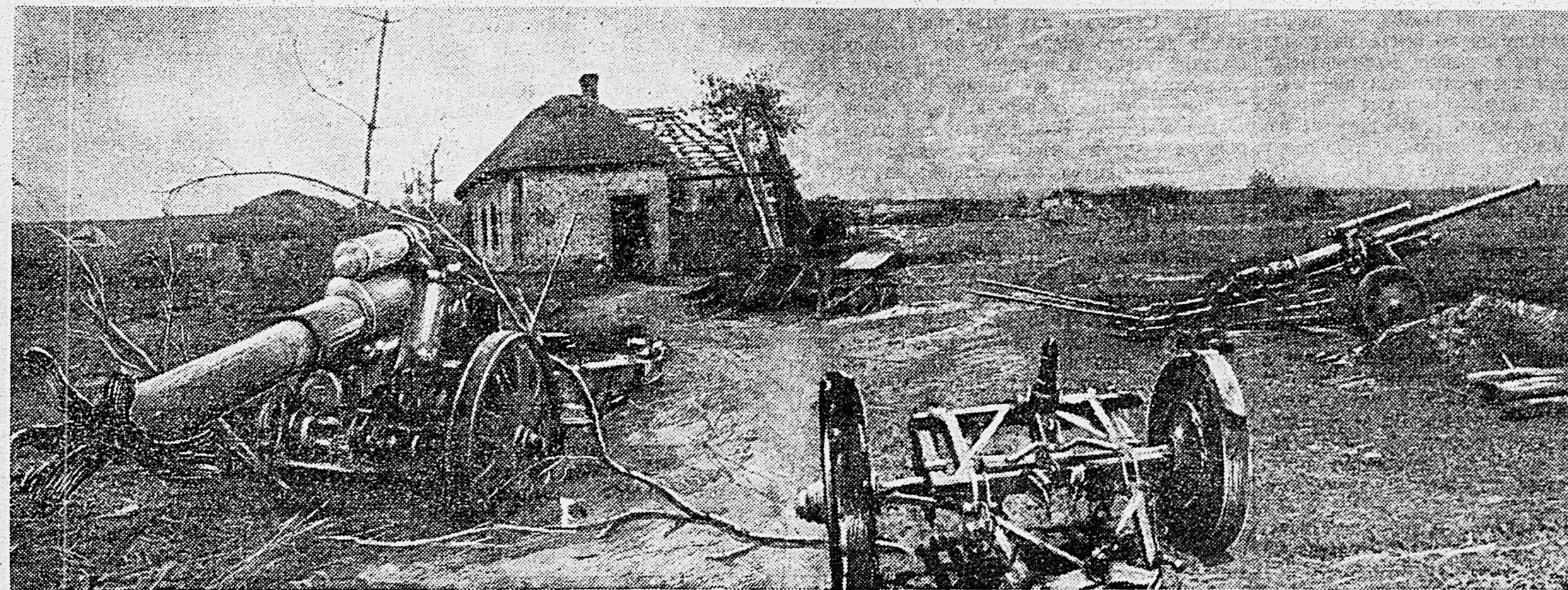
ЮГО-ЗАПАДНЫЙ ФРОНТ. Разгром одного из опорных пунктов немецкой обороны. Брошенные немцами тяжелые орудия и линии окопов.