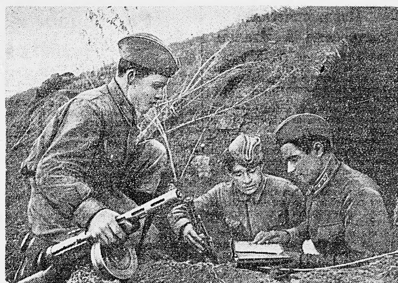
ЮГО-ЗАПАДНЫЙ ФРОНТ. Задание на разведку.