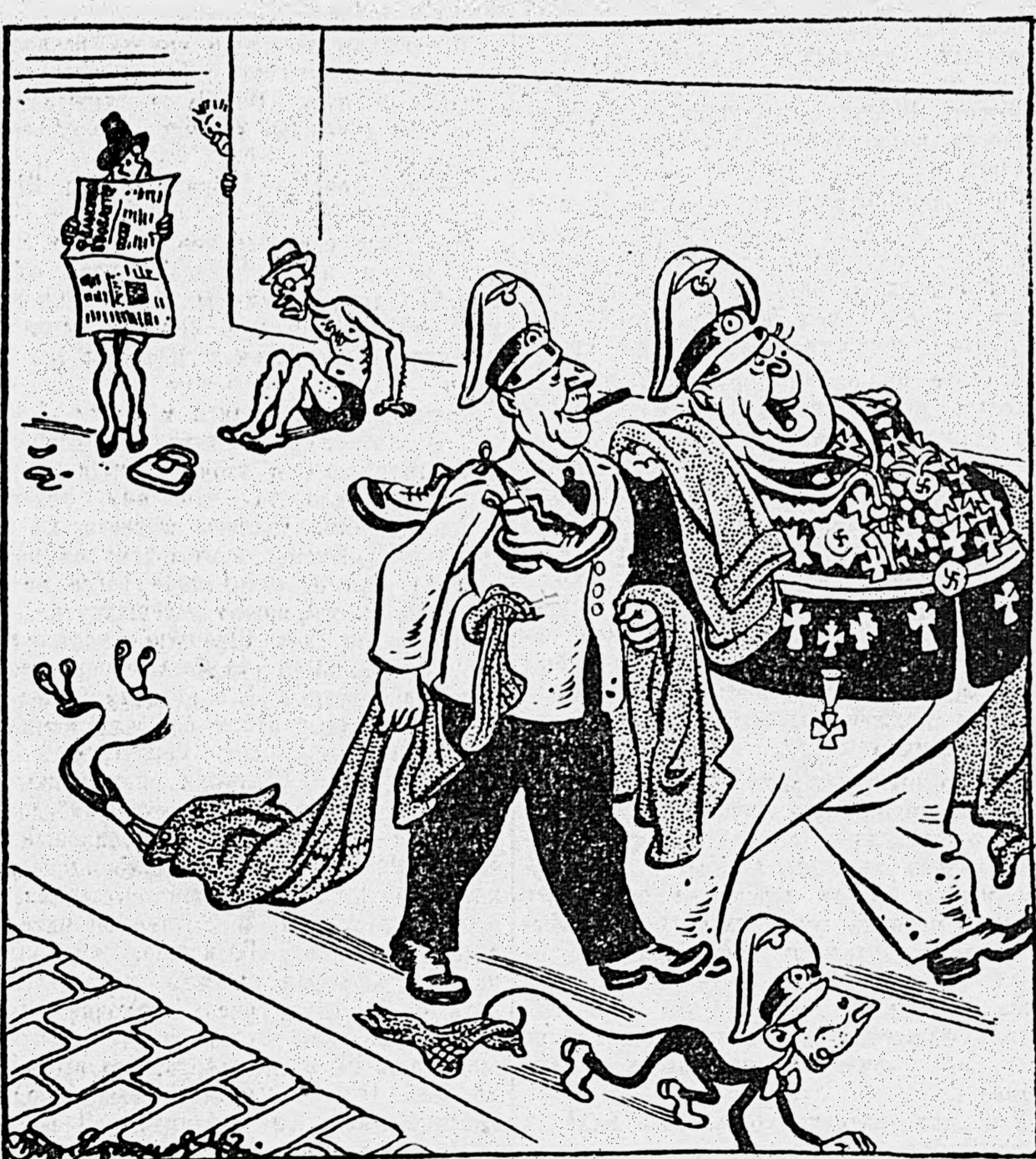
Мероприятия гитлеровских министров по заготовке «сырьевых резервов».

У населения Германии будет изъята старая одежда. По словам министра хозяйства Функа это есть германские «сырьевые резервы», от которых зависит сохранение работоспособности и мощи германского военного хозяйства.