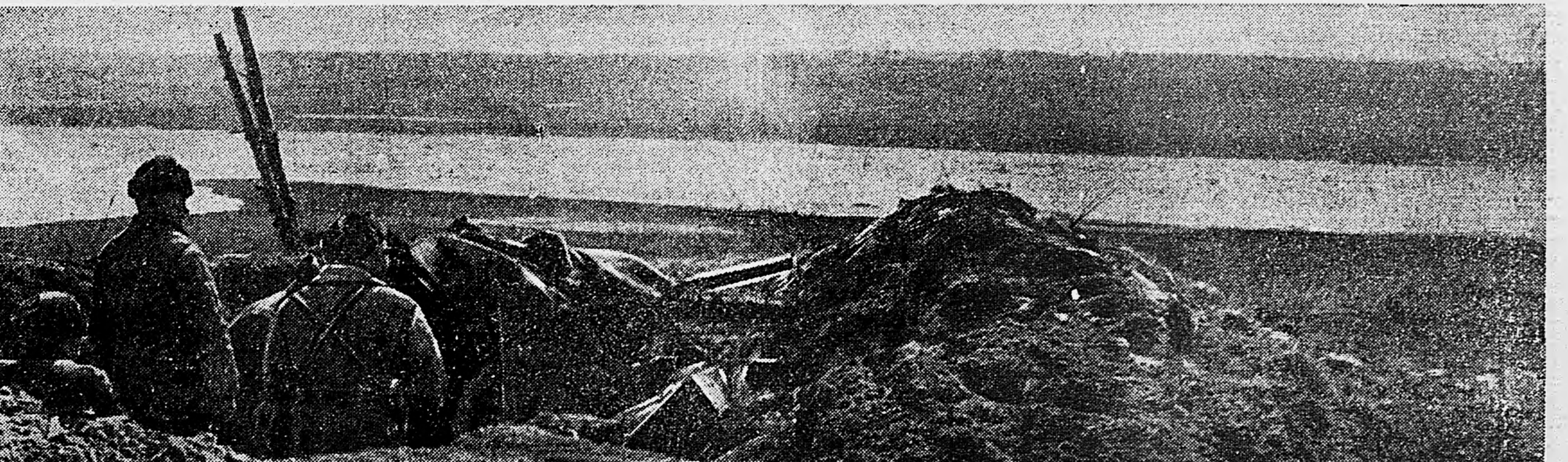
ЗАПАДНЫЙ ФРОНТ. Противотанковое орудие на прикрытом подступе к роще.

В настоящее время в тылу врага разворачиваются крупные бои между партизанскими полками и немецкими захватчиками.