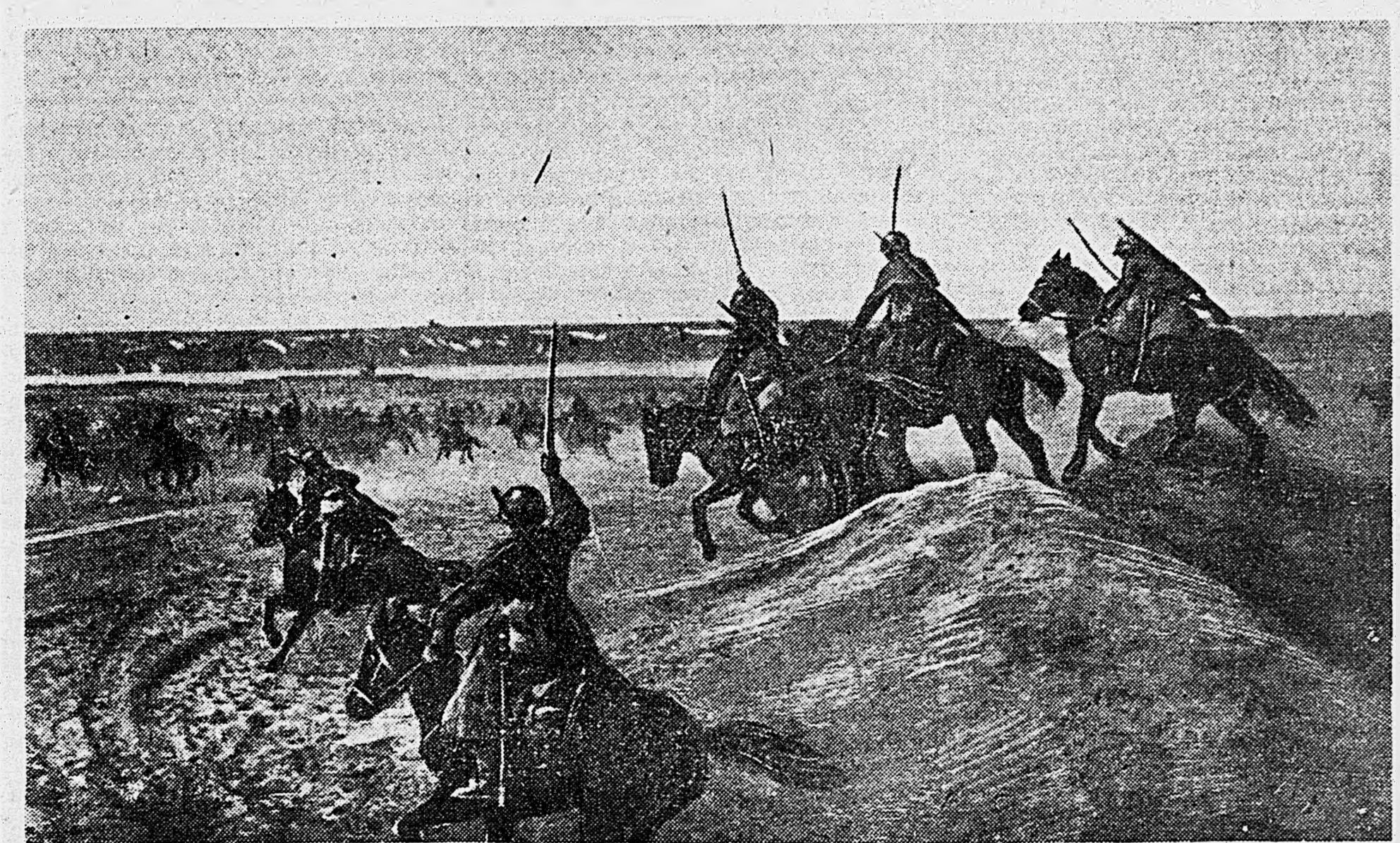
ЮГО-ЗАПАДНЫЙ ФРОНТ. Харьковское направление. Кавалеристы N части атакуют врага.