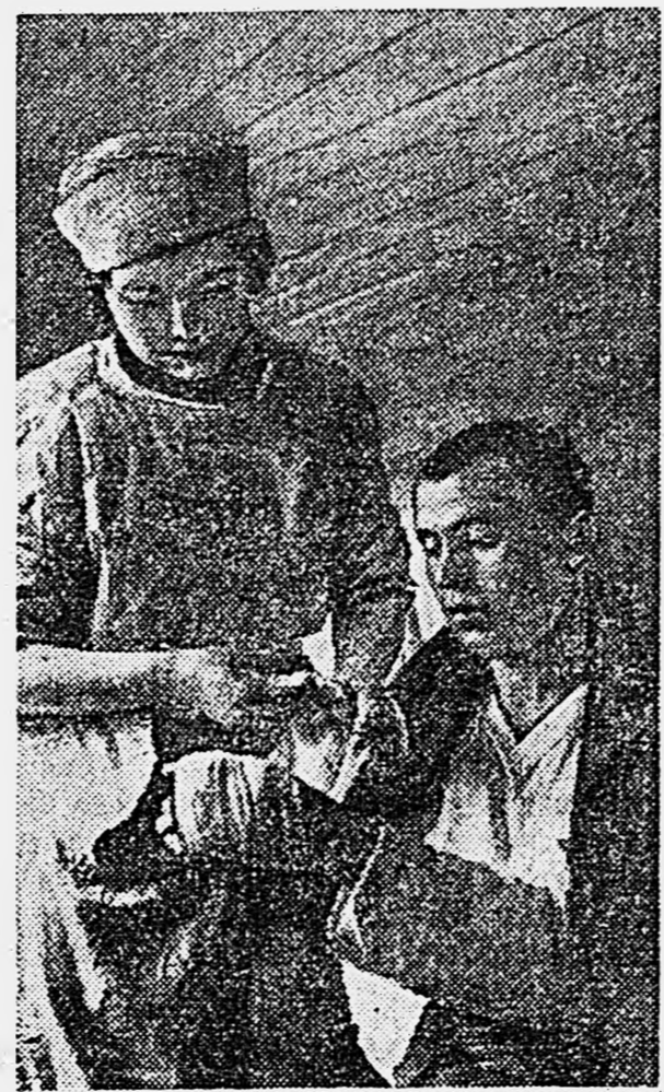
ЗАПАДНЫЙ ФРОНТ. В полевом госпитале. Перевозка.