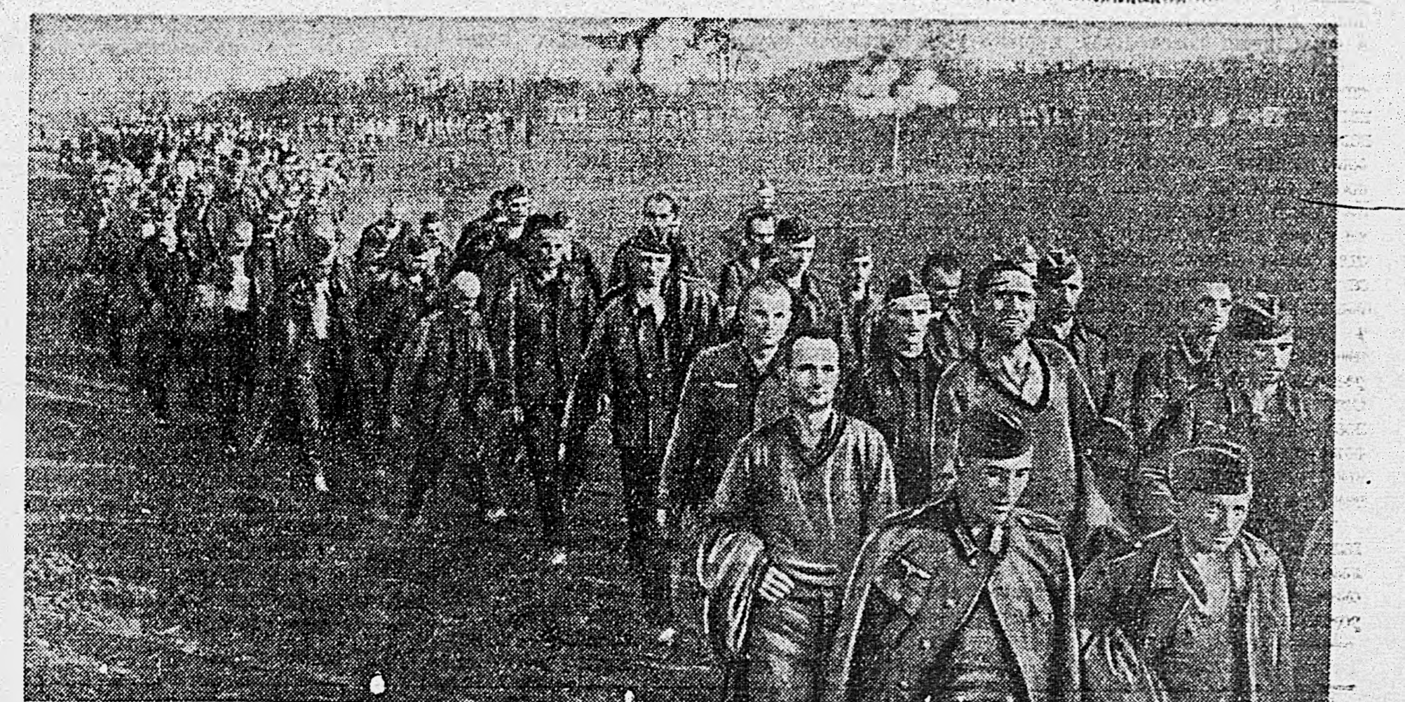
ЮГО-ЗАПАДНЫЙ ФРОНТ. Харьковский направление. Воспаленные немцы.