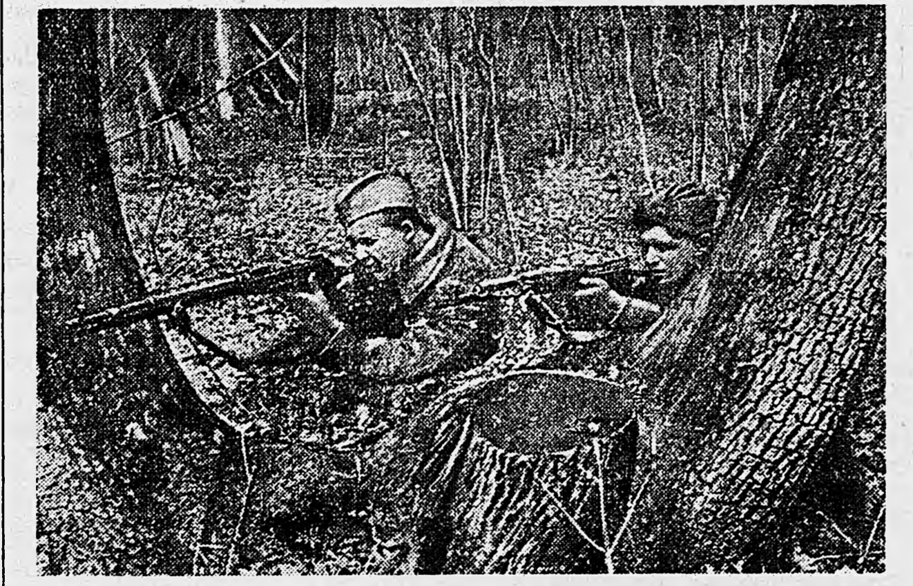
ЮГО-ЗАПАДНЫЙ ФРОНТ. Снайперский пост.

ром наибольшее число отличных стрелков. Этот закон определяет величину первой боевой деятельности парашютистов: десантник обрушивается на врага внезапно; у него короткий, разный удар, он бьет только на вылет. К тому же, как показывают факты деятельности парашютистов, десантник, находясь в тылу, будет иметь столько боеприпасов, сколько дастся туда ему переправить. Следовательно, парашютисты обязаны особенно строго соблюдать дисциплину огня, особенно рассчитывать на вылет и каждую пулю посвятить только в цель. Расточительное отношение к боеприпасам, находясь во вражеском тылу, — значит собственными руками обезоруживать себя.