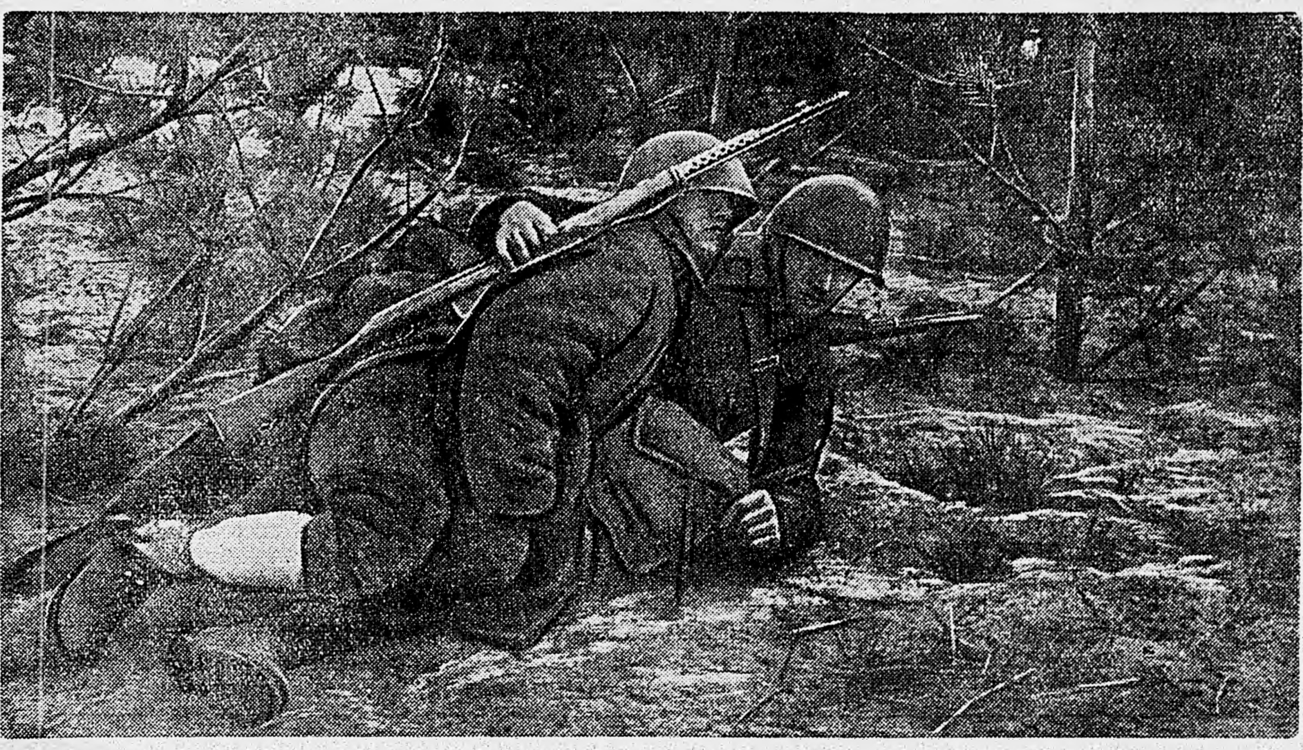
ЮГО-ЗАПАДНЫЙ ФРОНТ. Вынос раненого с поля боя.