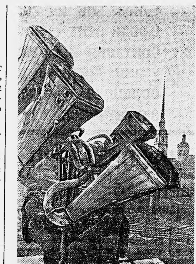
В ГОРОДЕ ЛЕНИНА. Звукоулавливающая установка противовоздушной обороны в боевой готовности.

Мих. РОЗЕНФЕЛЬД. ХАРЬКОВСКОЕ НАПРАВЛЕНИЕ, (по телеграфу).