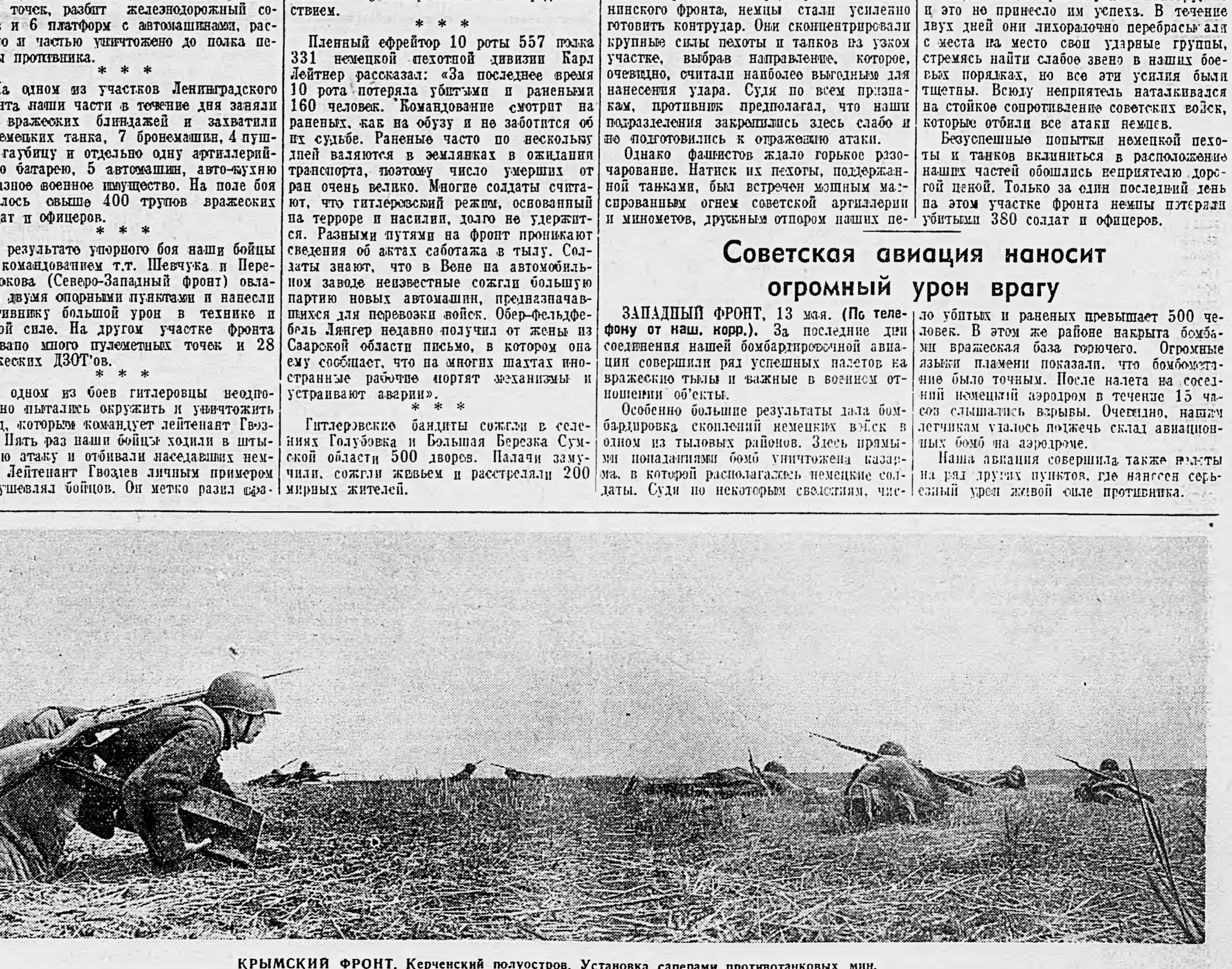
КРЫМСКИЙ ФРОНТ. Керченский полуостров. Установка саперами противотанковых мин. (Снято 12 мая. Снимок доставлен на самолете летчиком Рачевым)

В самом населенном пункте несколько дней ведут ожесточенную борьбу. Огневые батареи и дома, приспособленные немцами к обороне, переходят из рук в руки. Вчера особенно напряженный бой разгорелся на подступах к высоте, находящейся вблизи этого населенного пункта. Соседняя высота была занята нашими частями, но эту враг оборонял еще упорнее. Немцы имели здесь несколько заранее оборудованных огневых точек. Подступы к высоте были минированы. С утра в 7 часов, разведка оповестила командование, что высота находится в руках противника. Противник вел артиллерийский обстрел. Прорывался огонь артиллерии, к высоте продвигалась наша пехота, которая атаковала одновременно с нескольких сторон атаковала неприятеля. Фашисты упорно сопротивлялись, но под нарастающими ударами наших отрядовых подразделений, в конце концов, вынуждены были отступить. Только убитыми противника потерял на этой высоте 145 солдат и офицеров. 30 фашистов взято в плен.