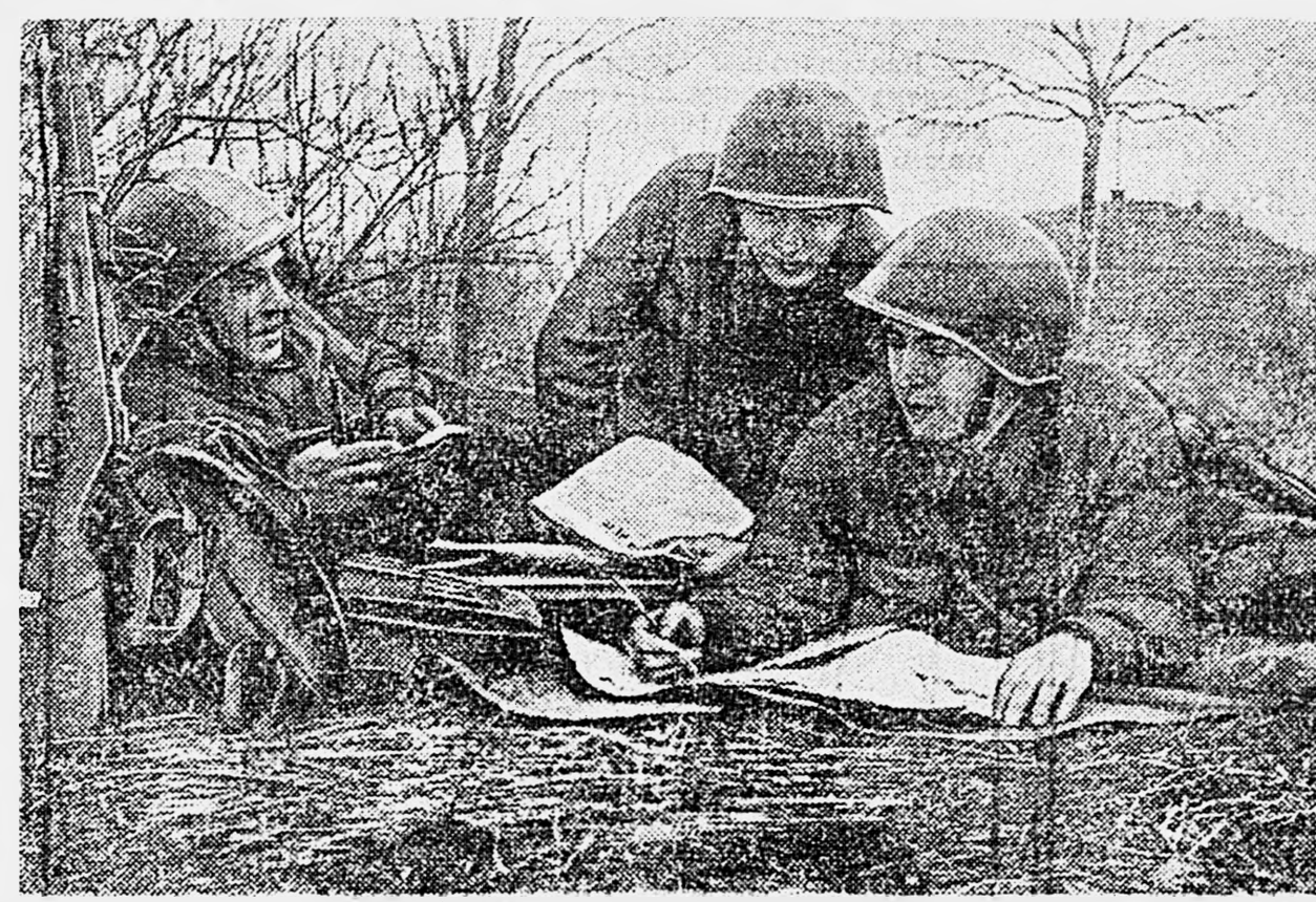
ЮЖНЫЙ ФРОНТ. За выпуском боевого листка.

Партизанские многотиражки и боевые листки поднимают на борьбу с гитлеровскими разбойниками советских людей, вселяют в их сердца уверенность в победу. Старший политрук Л. ВОЛКОВ.