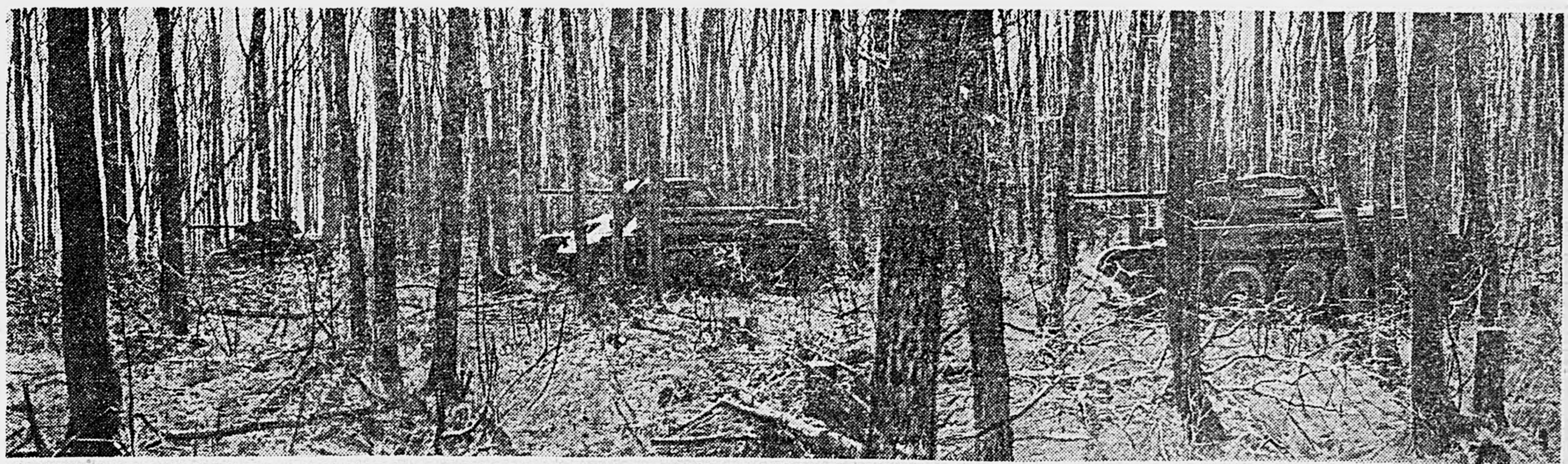
ЮГО-ЗАПАДНЫЙ ФРОНТ. Танки в засаде.

В другом месте фронта N часть одержала победу в бою за населенный пункт. Немцы оказали наступавшим упорное сопротивление. Они несколько раз переходили в контратаку, но ни одна из них не увенчалась успехом. Когда кончилась бой и фашисты отступили, на поле боя только убитых оказалось около 400 солдат и офицеров. Взяты пленные. Среди них один офицер.