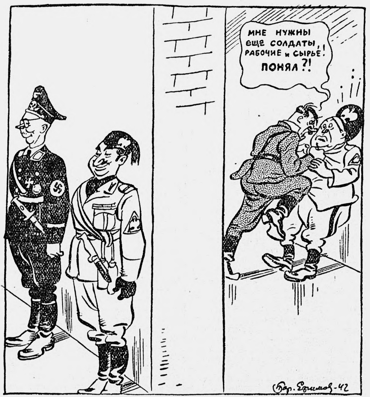
Развитие германо-итальянского сердечного сотрудничества