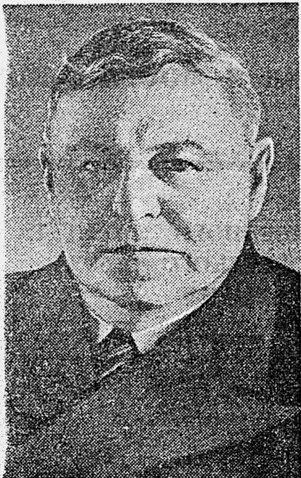
Академик Е. В. Тарле.