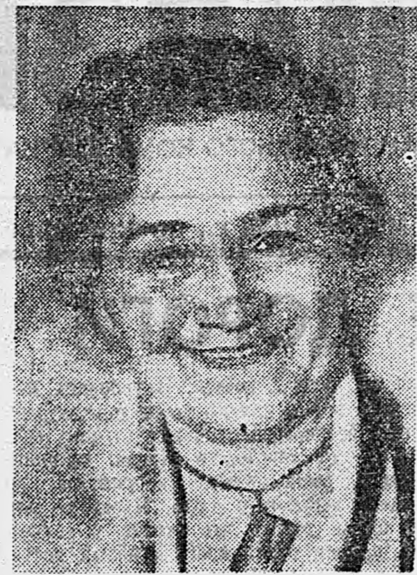
Народная артистка СССР О. Л. Книппер-Чехова.