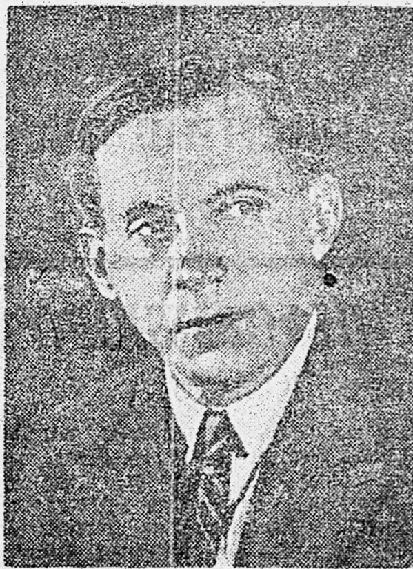
Поэт М. Ф. Рыловский.