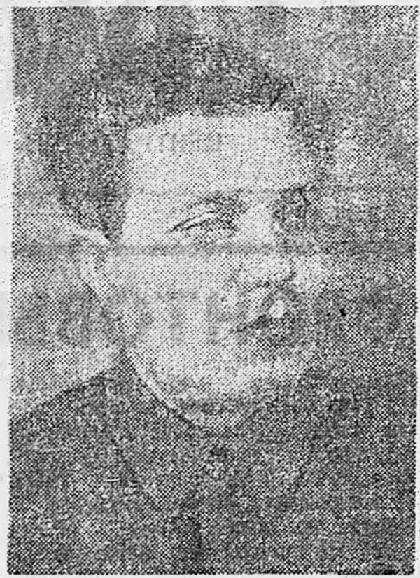
Режиссер Л. В. Варламов.