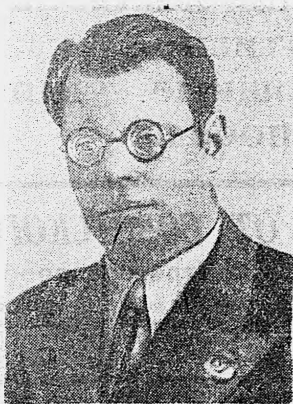
Поэт М. В. Исаковский.