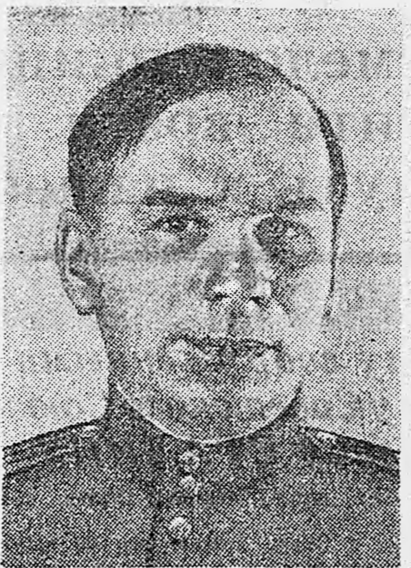
Писатель Е. О. Габрилович.