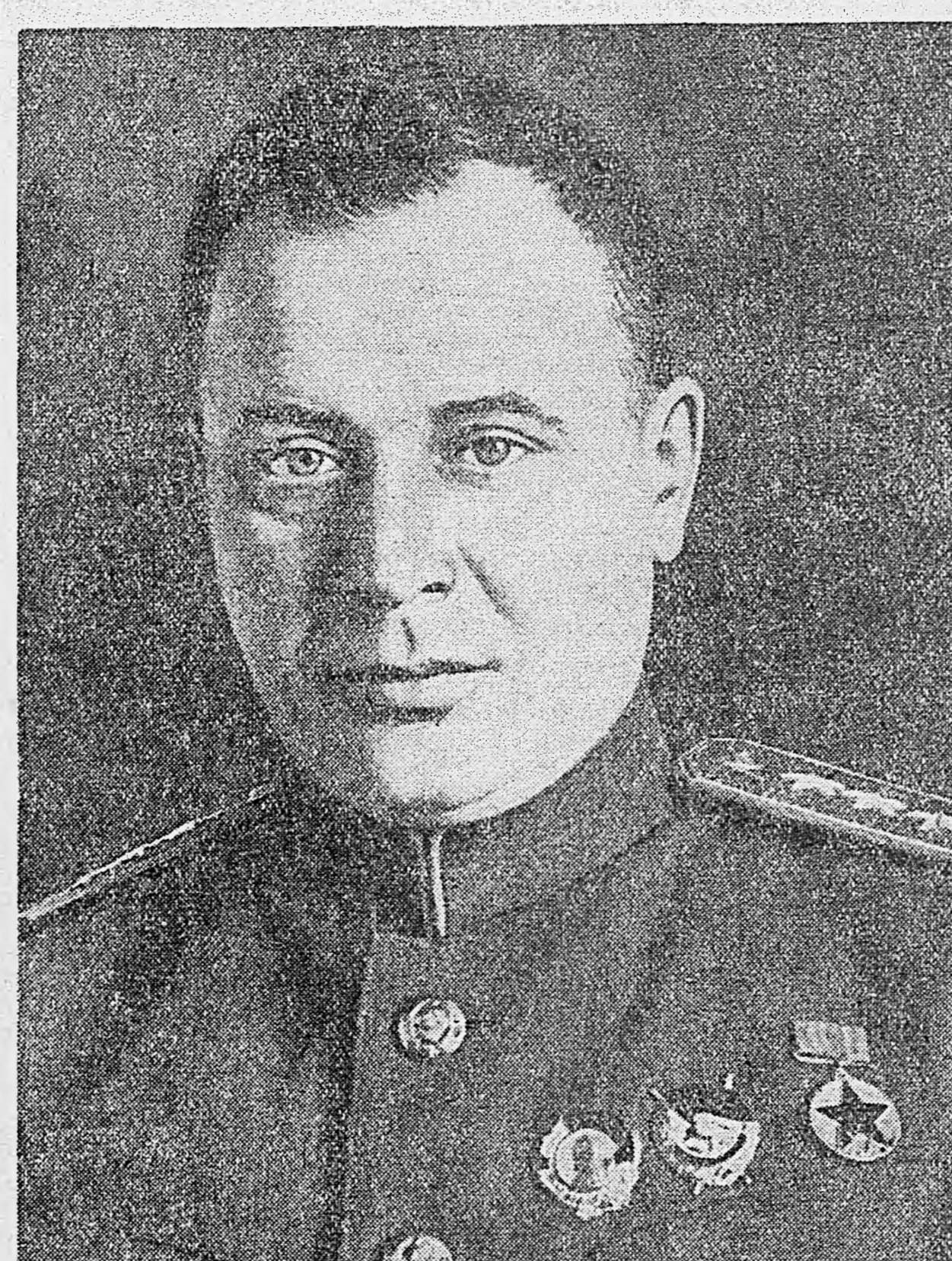
Маршал авиации Александр Александрович Новиков.

Южнее озера Пльмень наши войска продолжают наступательные бои. Советские подразделения переправились через водный рубеж и заняли десять сильно укреплен-