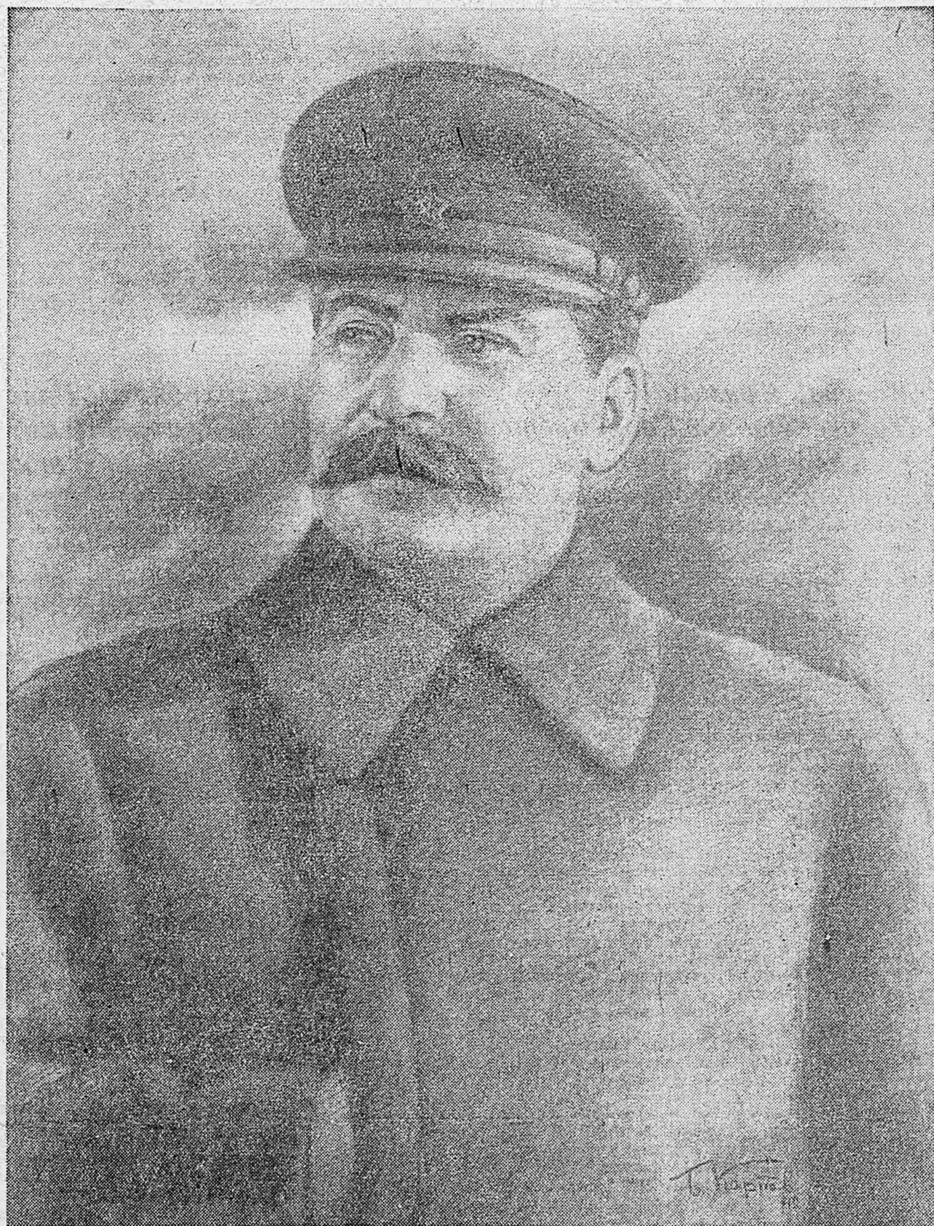
Верховный Главнокомандующий вооруженными силами СССР, Маршал Советского Союза И. В. СТАЛИН.

Слава отважным патриоткам, которые в решающий момент Отечественной войны отдают все силы на дело полного разгрома немецко-фашистских захватчиков!