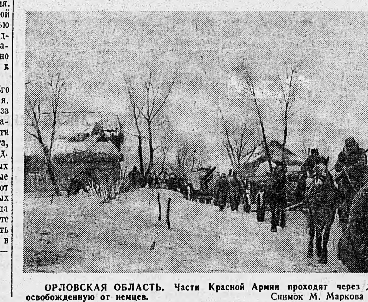
ОРЛОВСКАЯ ОБЛАСТЬ. Части Красной Армии проходят через деревню, освобожденную от немцев.