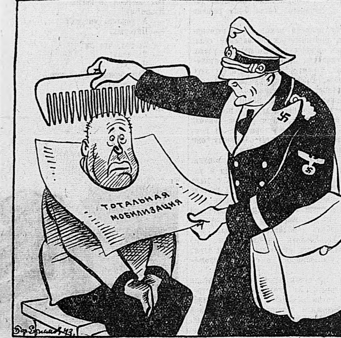
Прочесывание итальянских резервов.