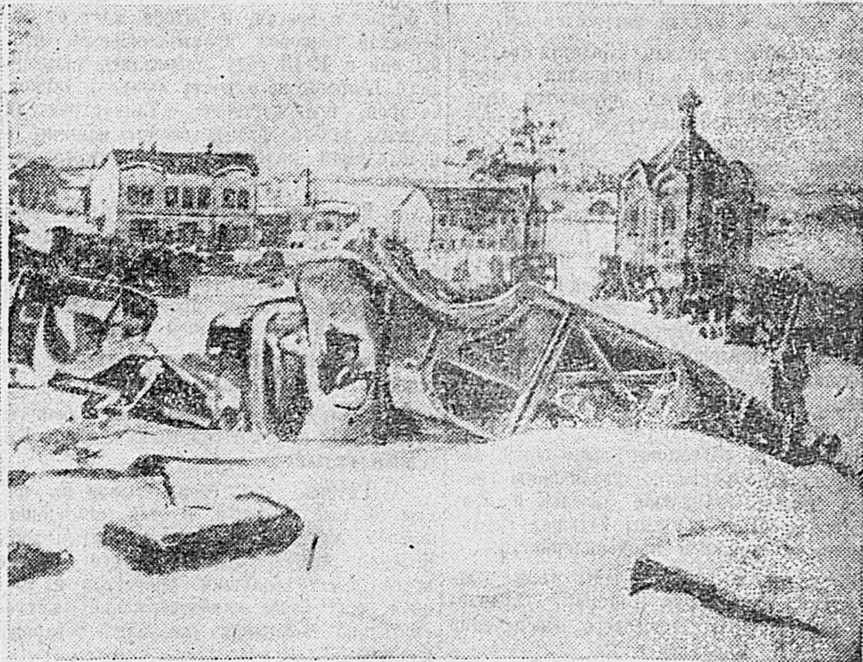
В РАЙОНЕ ДЕМЯНСКА. На снимках: слева — большое кладбище немецких солдат и офицеров в селе Черный ручей. В центре — немецкие солдаты, взятые в плен на подступах к городу Демянску. Справа — уничтоженная техника противника на улице Демянска.