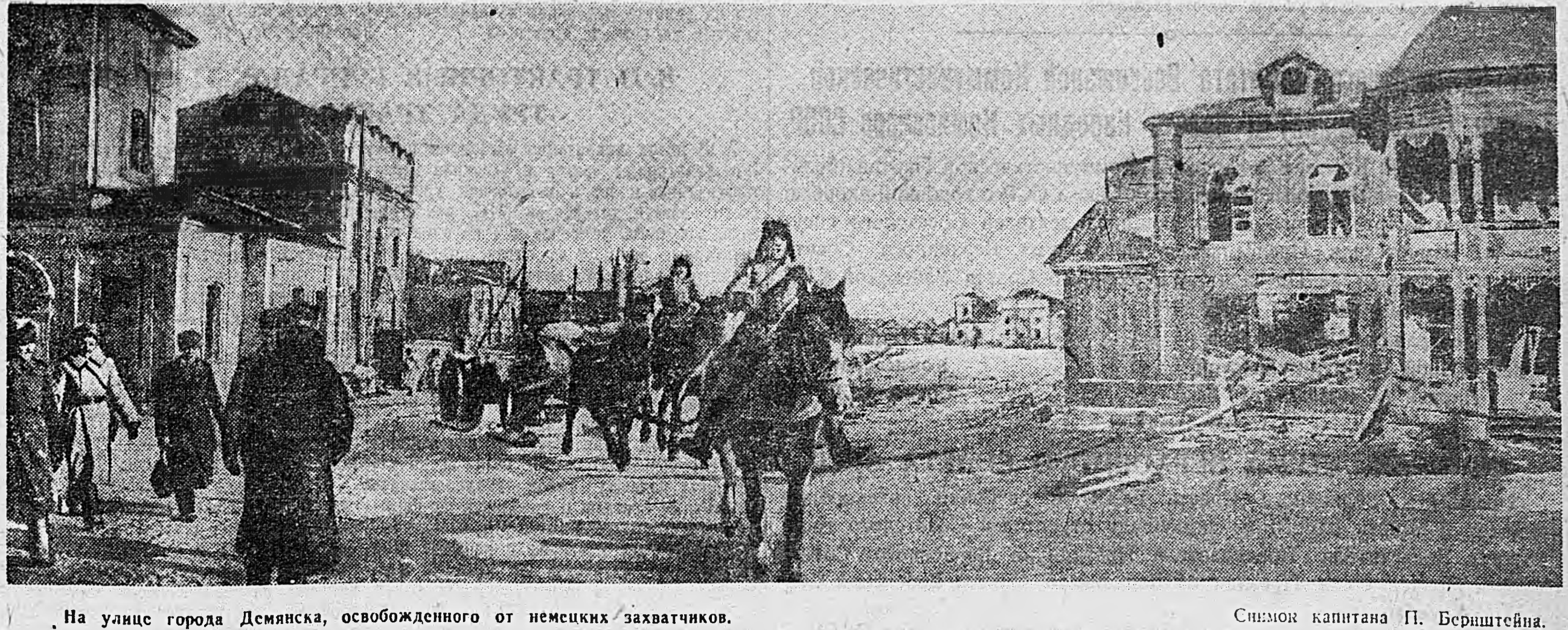
На улице города Демьянска, освобожденного от немецких захватчиков.