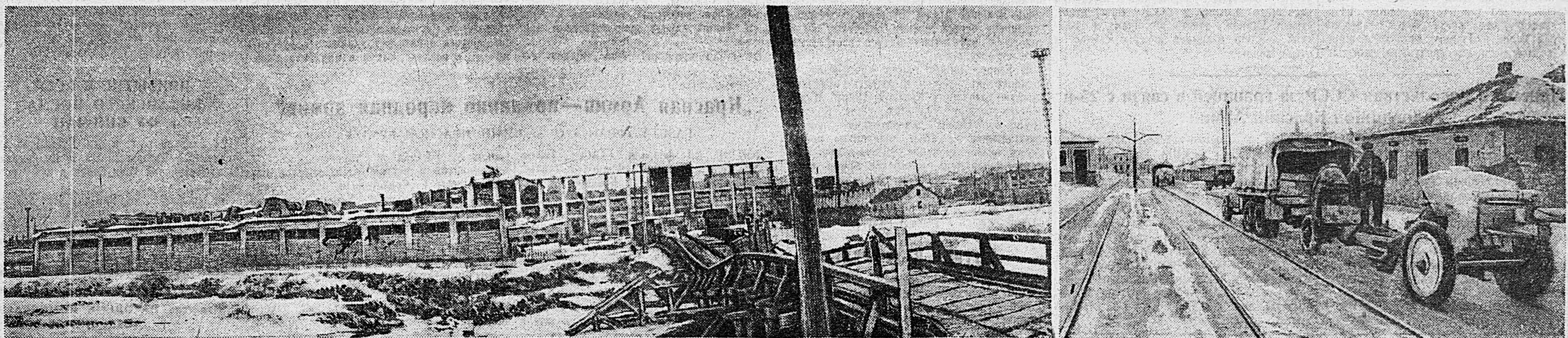
В ОСВОБОЖДЕННОМ ВОРОШИЛОВГРАДЕ. 1. Паровозостроительный завод имени Октябрьской революции, разрушенный немецкими оккупантами. 2. Одна из окраин города. Фашистские мародеры сняли и вывезли в Германию провода с трамвайных линий.