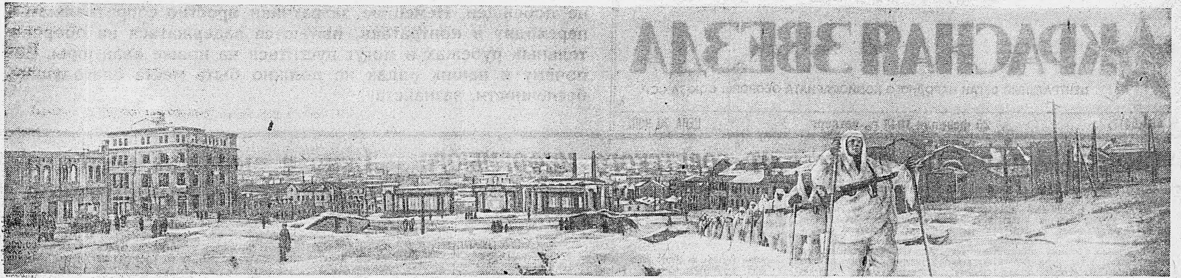
В ОСВОБЖДЕННОМ ВОРОШИЛОВГРАДЕ. На площади Революция. Слева — дома, сожженные и разрушенные фашистскими громлами.