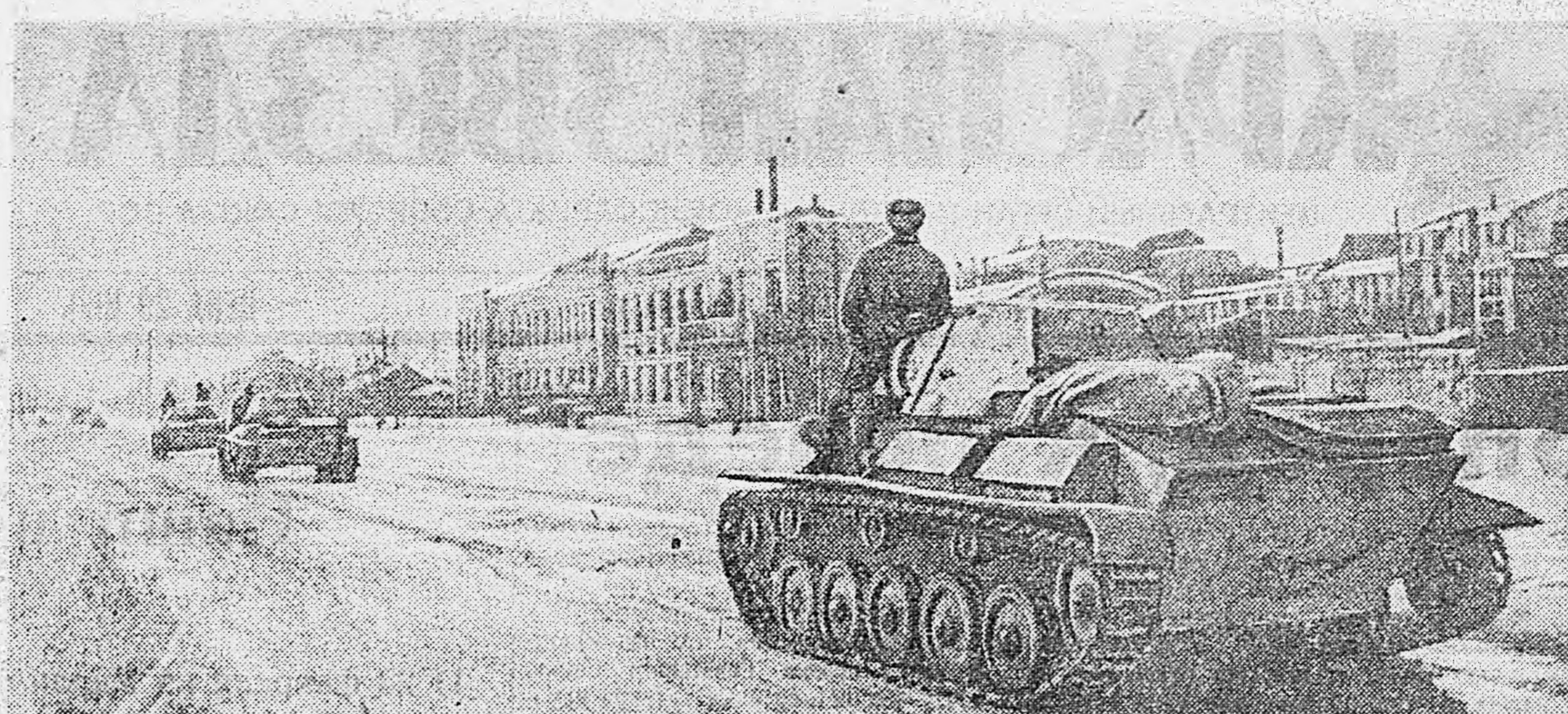
В освобожденном Ворошиловграде. Советские танки проходят по улицам города.