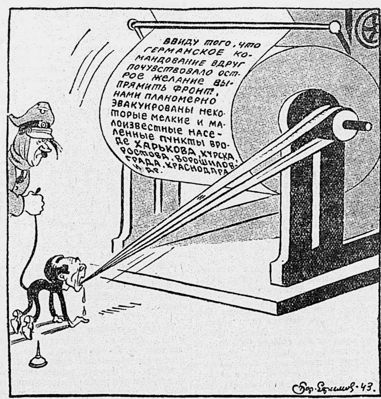
Рис. Бер. Ефимова.