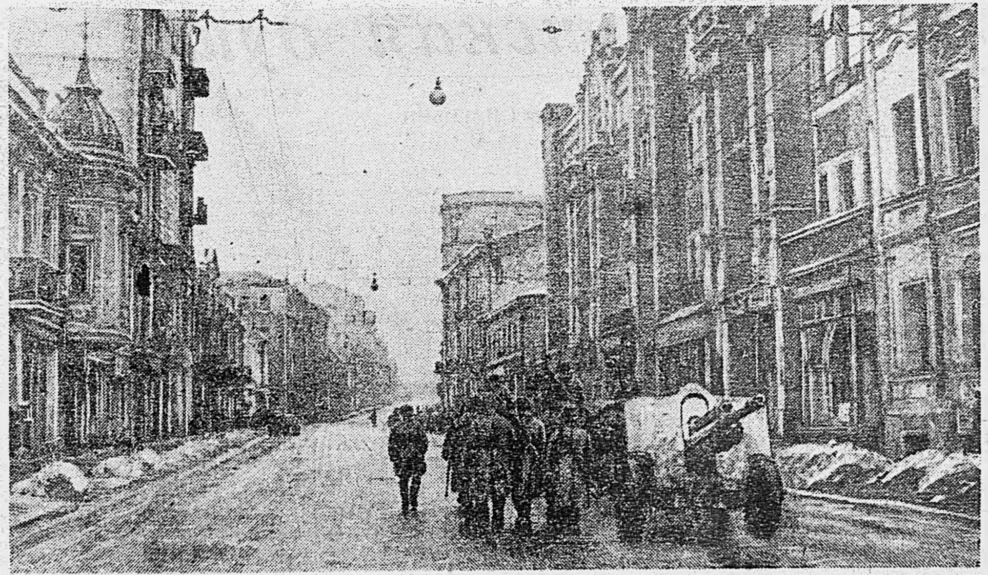
В ОСВОБОЖДЕННОМ ХАРЬКОВЕ. На Сумской улице.

Капитан М. ТИХОМИРОВ. ХАРЬКОВ. 18 февраля. (По телеграфу).