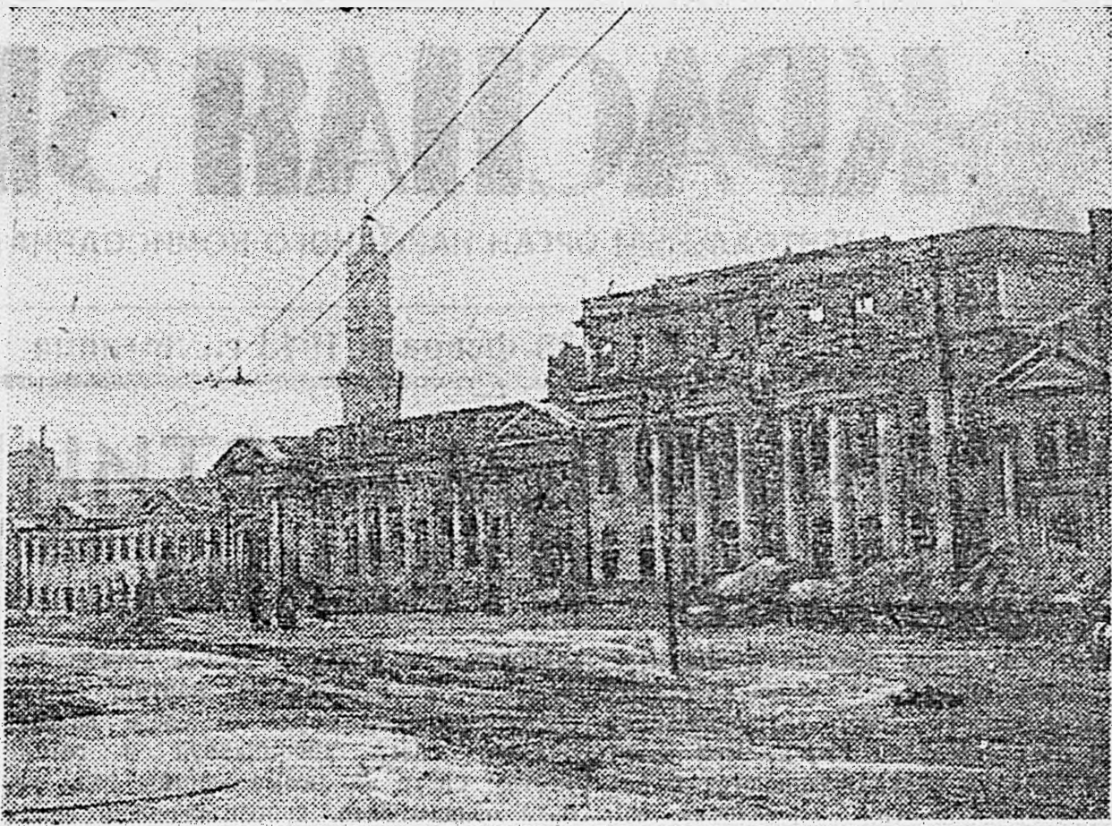
В ОСВОБОЖДЕННОМ ХАРЬКОВЕ. 1. У здания горсовета. 2. Отступая, немцы варварски разрушали город. На одной из улиц, где хозяйничали гитлеровские мерзавцы. 3. Дворец пионеров, разрушенный немцами. Доставлены на самолете, пилотируемом старшим лейтенантом В. Докучиным.