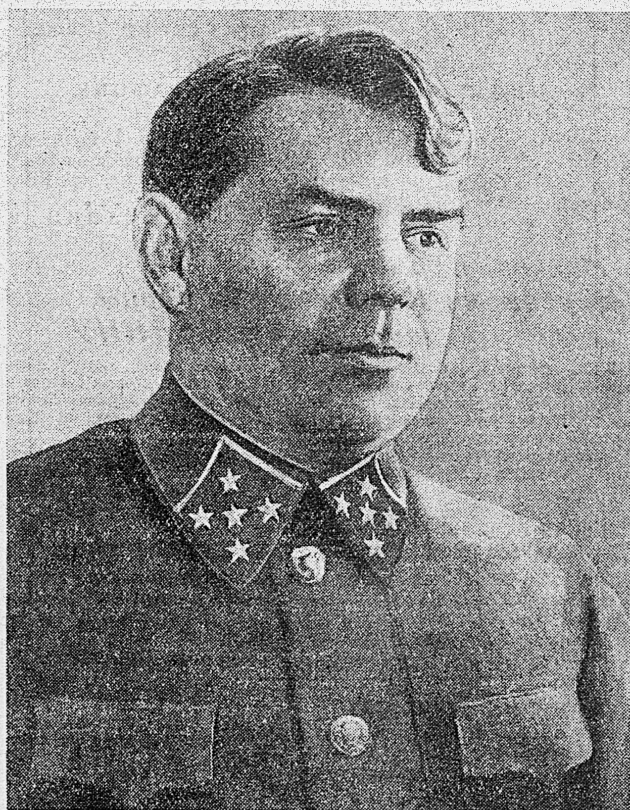
Маршал Советского Союза Александр Михайлович Василевский.

Подобная галиматья, которую перелает немецкое командование, как нельзя лучше свидетельствует о явном замешательстве в лагере гитлеровцев. Потери немецкими войсками важнейших стратегических позиций, какими являются города Ростов и Ворошиловград, по объяснению гитлеровцев произошла по «точному намеченному плану». Законно задать вопрос — с чего это гитлеровцы вдруг воспылали желанием покинуть города, в боях за которые пролито так много немецкой крови? Разумеется, немцы ушли из Ростова и Ворошиловграда не по указу немецкого командования. Красная Армия вытеснила немецко-фашистских захватчиков из этих городов и, преследуя по пятам, гонит их на запад. Завтра немецкое командование наверно придется сообщить, что «немецкие войска, действуя в точности по намеченному плану, оставили город Харьков?»!