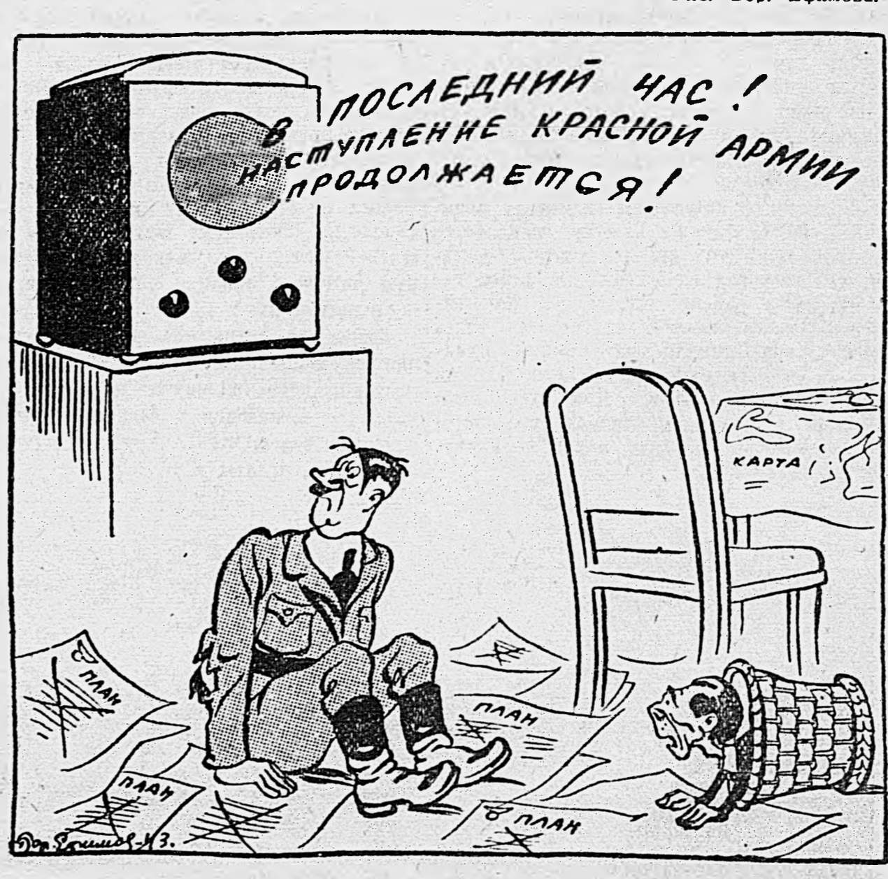
Рис. Бод. Ефимова. Ответственный редактор Д. ВАДИМСОВ. Издатель НАРОДНЫЙ КОМИССАРИАТ ОБОРОНЫ СОЮЗА ССР.