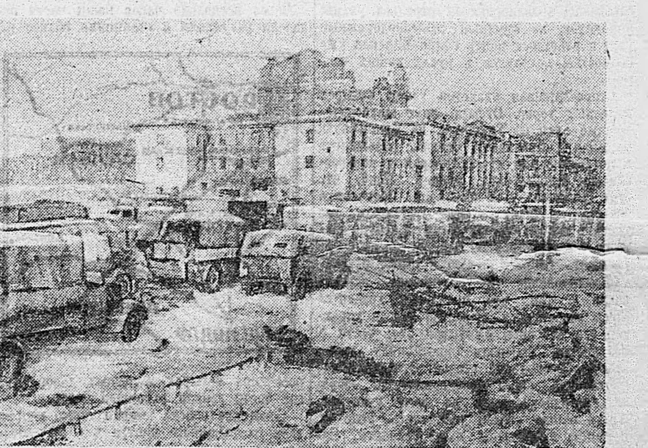
В ОСВОБОЖДЕННОМ СТАЛИНГРАДЕ. 1. Немцы, взятые в плен во время последних боев в городе. 2. Немецкие машины, захваченные в числе богатых трофеев.