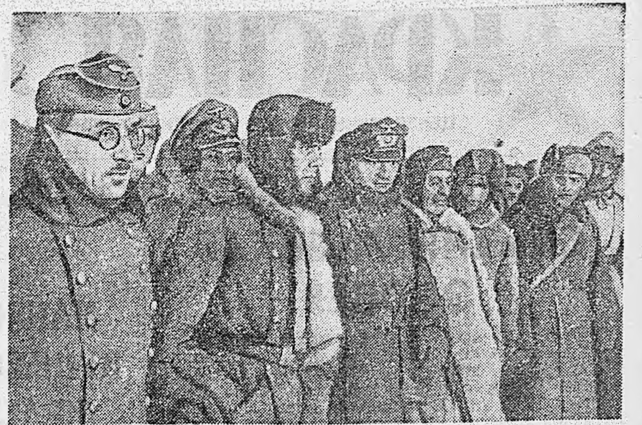
В СТАЛИНГРАДЕ. Пленные нашими войсками в районе Сталинграда гитлеровские офицеры.