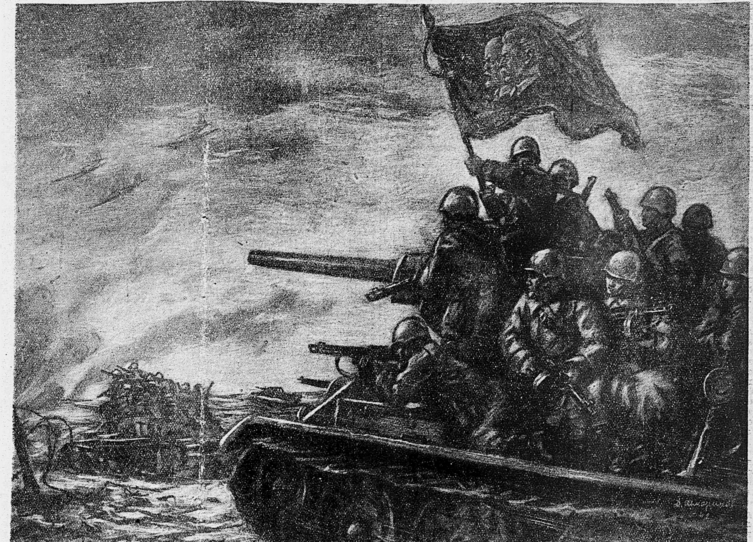
В бой за родину!

Воины Красной Армии! По знаменам Ленина — Сталина вперед, на разгром немецких захватчиков в 1942 году!