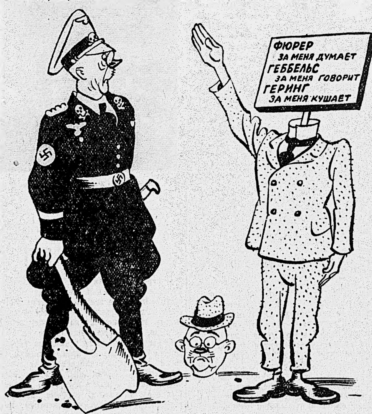
Рис. Бор. Ефимова.

Гитлеровская печать продолжает яростную кампанию против «враждебных мыслей» и «неужубных разговоров», угрожая при этом рубить головы ослушникам.