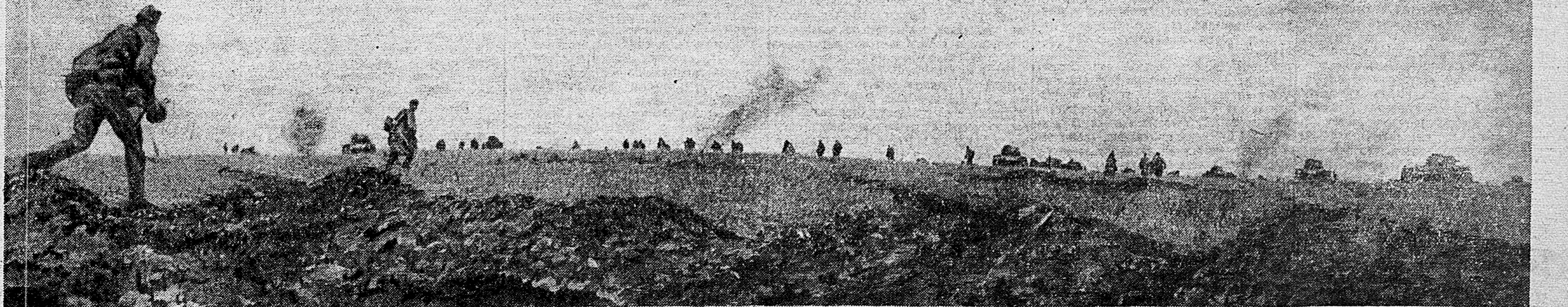
ВОСТОЧНЕЕ ОРЛА. Н дивизия при поддержке танков и самоходной артиллерии прорывает линию немецких укреплений у деревни Орловка.

В своих выступлениях лауреаты горячо благодарили советское правительство за высокую награду. (ТАСС).