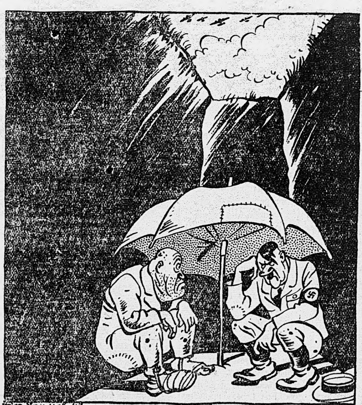
Фюрер и дуче демонстрируют общность ШЕЛИ...

В Северной Италии состоялось свидание Гитлера и Муссолини.