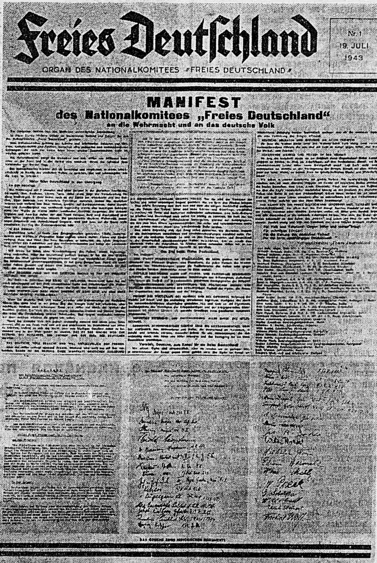
Снимок первой страницы газеты «Свободная Германия» № 1.

Это правительство должно быть открытым и располагать необходимой властью,