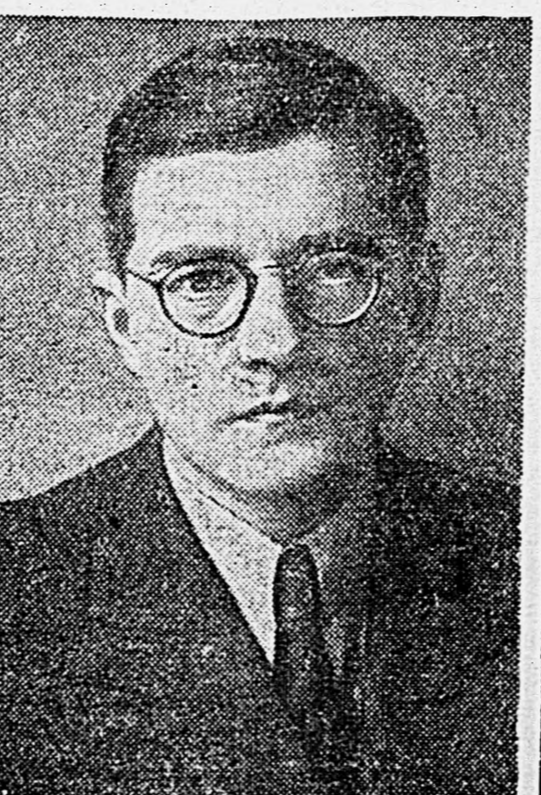
Композитор Д. Д. ШОСТАКОВИЧ.