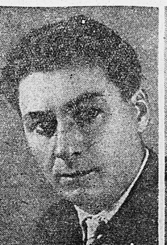
Артист М. Г. ГЕЛОВАНИ.