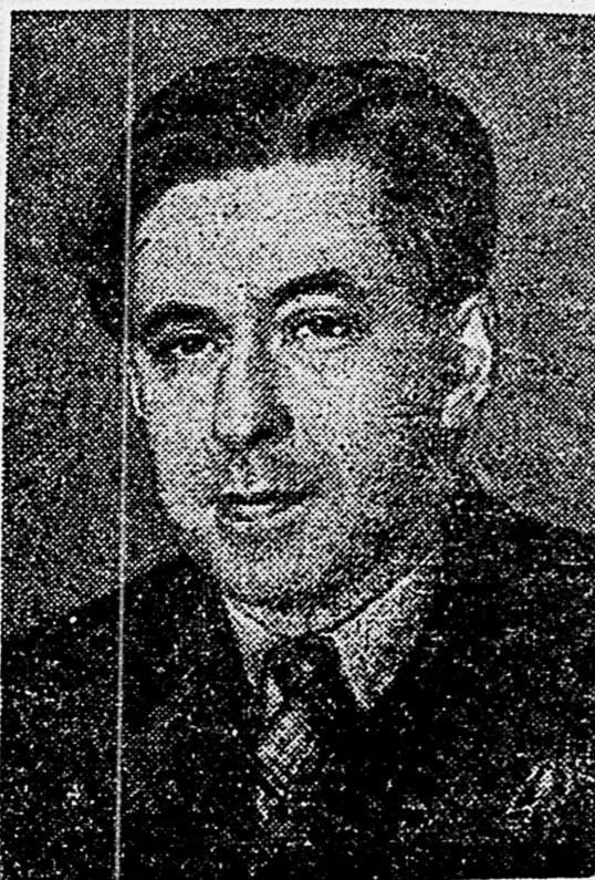
Писатель И. Г. ЭРЕНБУРГ.