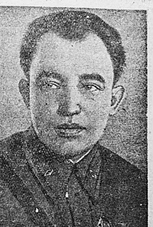
Драматург А. Е. КОРНЕЙЧУК.