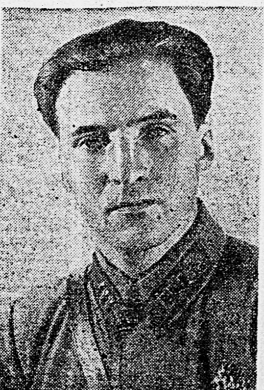
Писатель К. М. СИМОНОВ.