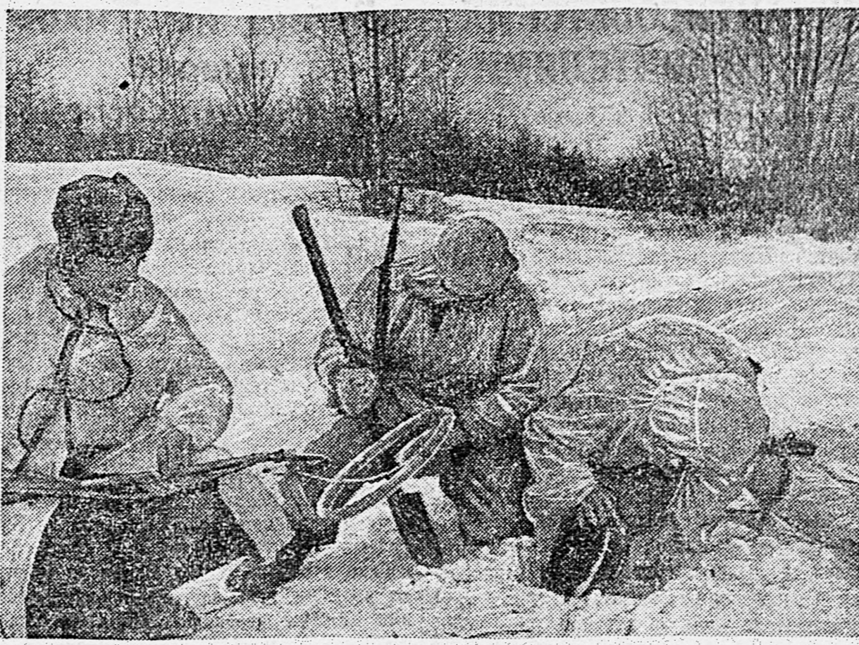
СЕВЕРНО-ЗАПАДНЫЙ ФРОНТ. Разминирование дороги нашими саперами в районе окруженной 16-й немецкой армии.

Женщины земли украинской, краса и гордость наша! Помогите партизанам уничтожать врага! Партизаны вашей родины нашей, все на борьбу! Готовьте победу! Помогите партизанской Красной Армии! Пусть же пропадет проклятое кровавое гитлеровское шайка, чтобы не осталось от нее и следа на земле! Да здравствует вечно наш народ и земля наша свободная, Украинская, Советская! Да здравствует наш брат — великий русский народ, и все народы-братья! Да здравствует творец нашей победы Сталин!