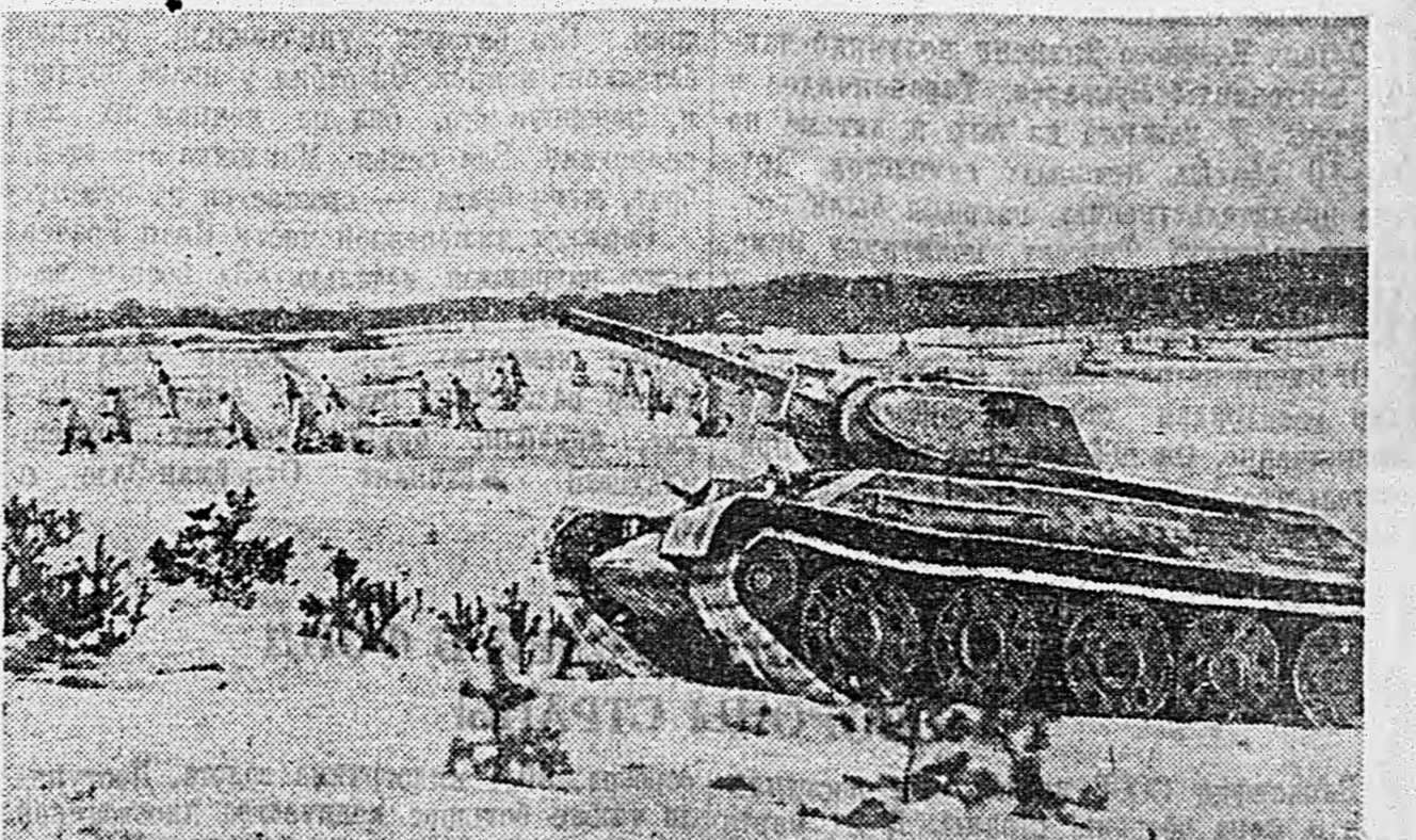
ДЕЙСТВУЮЩАЯ АРМИЯ. Совместные действия танков 4-й Гвардейской танковой бригады с пехотой. На снимках: 1. Десантная группа выезжает на операцию. 2. Высадка десанта. 3. Атака пехоты при поддержке танков.