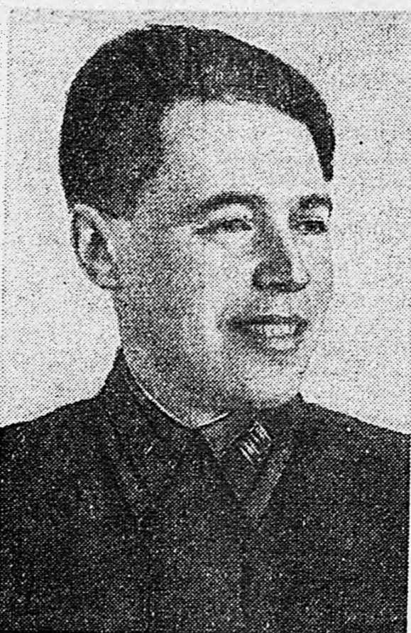
Портрет человека, упомянутого в тексте.

Вышел шестой номер журнала для германских солдат «Фронт-иллюстрирте». На первой странице помещена фотография группы немецких солдат и офицеров 312 полка, сданных в плен частям Красной Армии.