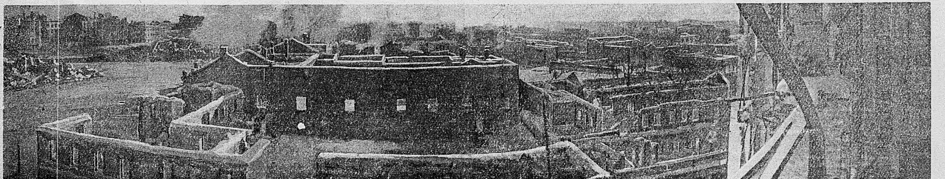
В ВОРОНЕЖЕ. Дома, разрушенные и сожженные немцами во время воздушных налетов.