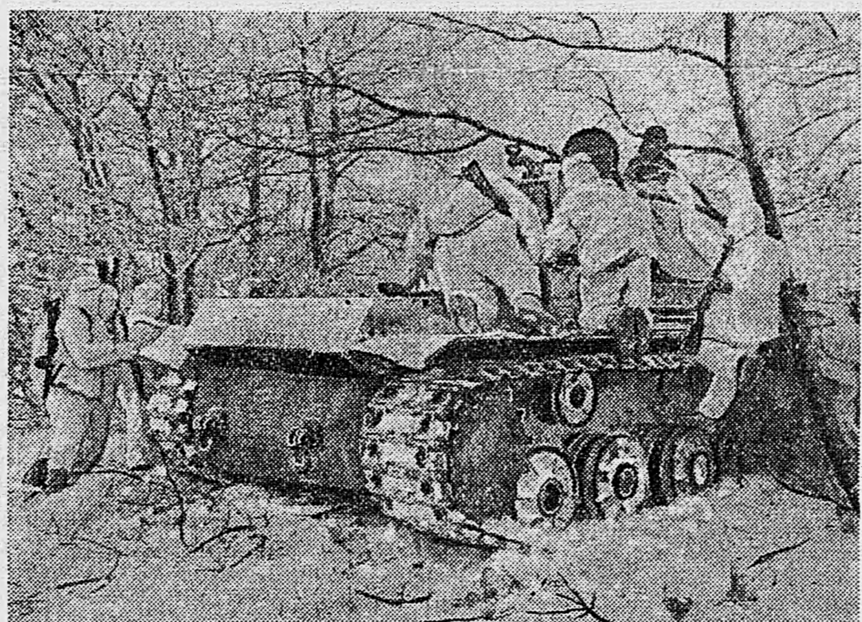
ВОРОНЕЖСКИЙ ФРОНТ. Посадка танкового десанта.

Героической обороне Сталинграда посвящена выпускаемая издательством писателя Василия Гроссмана «Сталинград». В ней публикуются записки писателя, в течение нескольких месяцев находившегося в районе Сталинграда. Издается вторая книга очерков Константина Симонова «От Черного до Баренцева моря», где напечатаны его лучшие фронтовые корреспонденции за 1942 год. В ближайшее время выйдут книги стихов о войне Илья Эренбурга и новая поэма Александра Твардовского «Василий Теркин». (ТАСС).