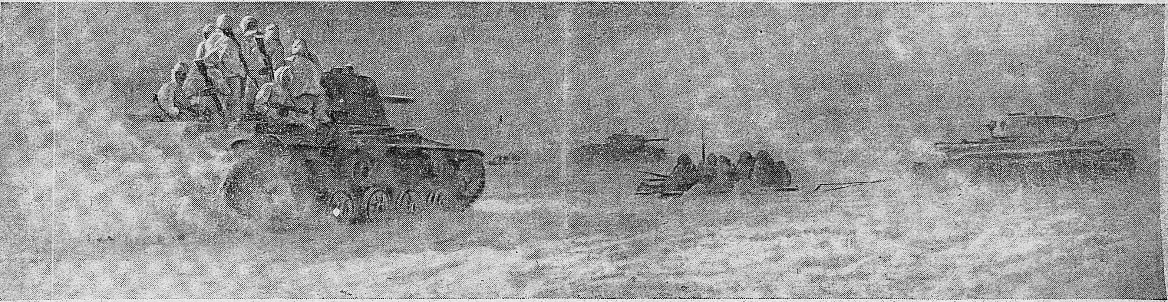
ВОРОНЕЖСКИЙ ФРОНТ. Танки прорыва идут в атаку.