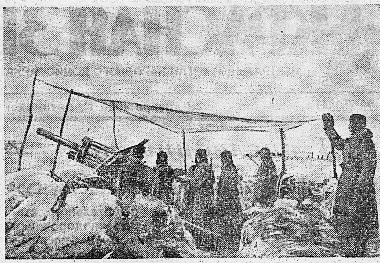
ПОД СТАЛИНГРАДОМ. Батарея громит немецкие укрепления.

Вагонники единодушно решили досрочно выводить февральский план. Решено также немедленно начать сбор подарков фронтовикам.