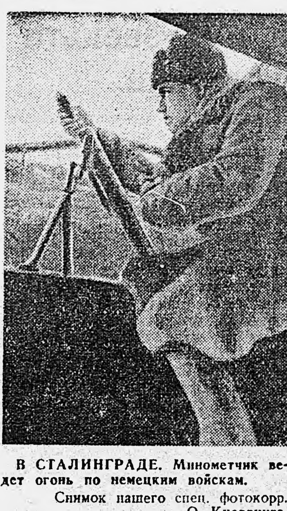
В СТАЛИНГРАДЕ. Минометчик ведет огонь по немецким войскам.