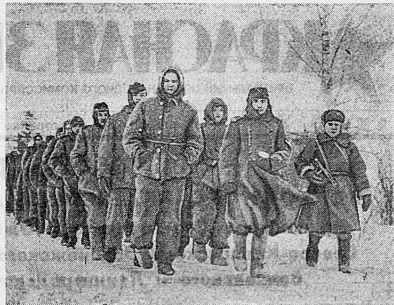
ЮЖНЕЕ ЛАДОЖСКОГО ОЗЕРА. Пленные немецкие солдаты и офицеры, захваченные нашими войсками.