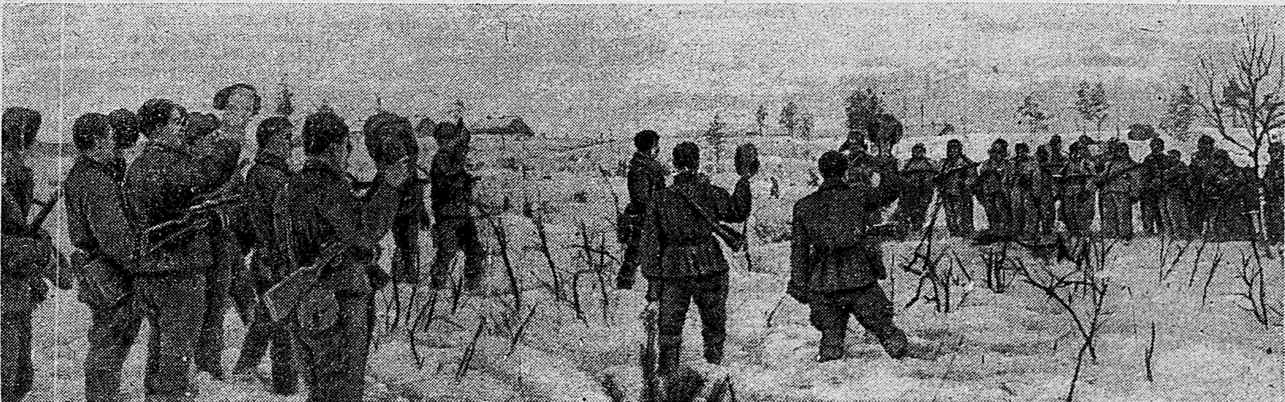
ЮЖНЕЕ ЛАДОЖСКОГО ОЗЕРА. Блокада Ленинграда прорвана, бойцы и командиры Ленинградского и Волховского фронтов встретились.