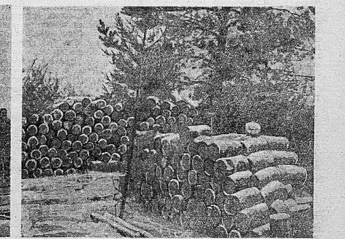
ЮЖНЕЕ ЛАДОЖСКОГО ОЗЕРА. Немецкие автомашины, орудия и склад с боеприпасами, захваченные нашими войсками.