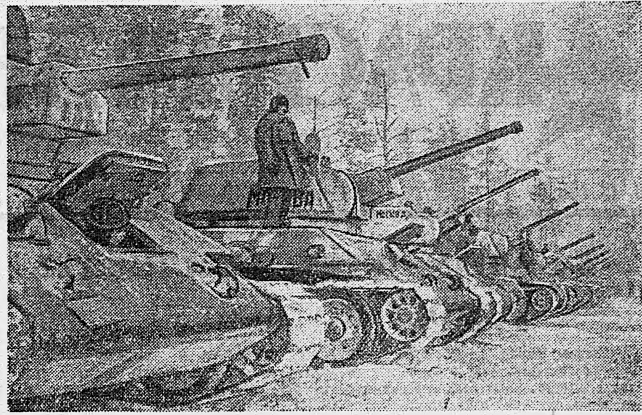
Колонна танков, построенных на средства трудящихся города Москвы и переданных Н танковой части.