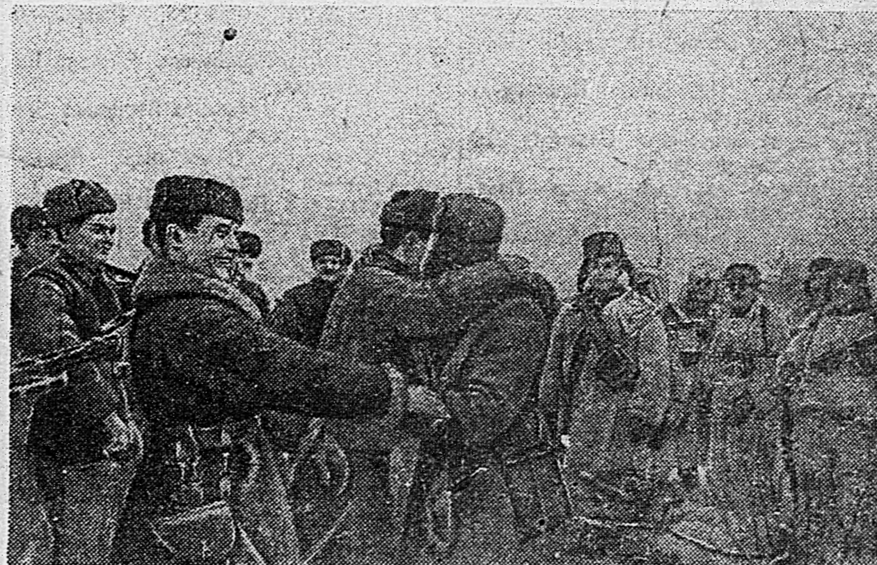
Снимки нашего степи. (Снимки доставлены на самолете летчиком старшим лейтенантом В. Сульковым).