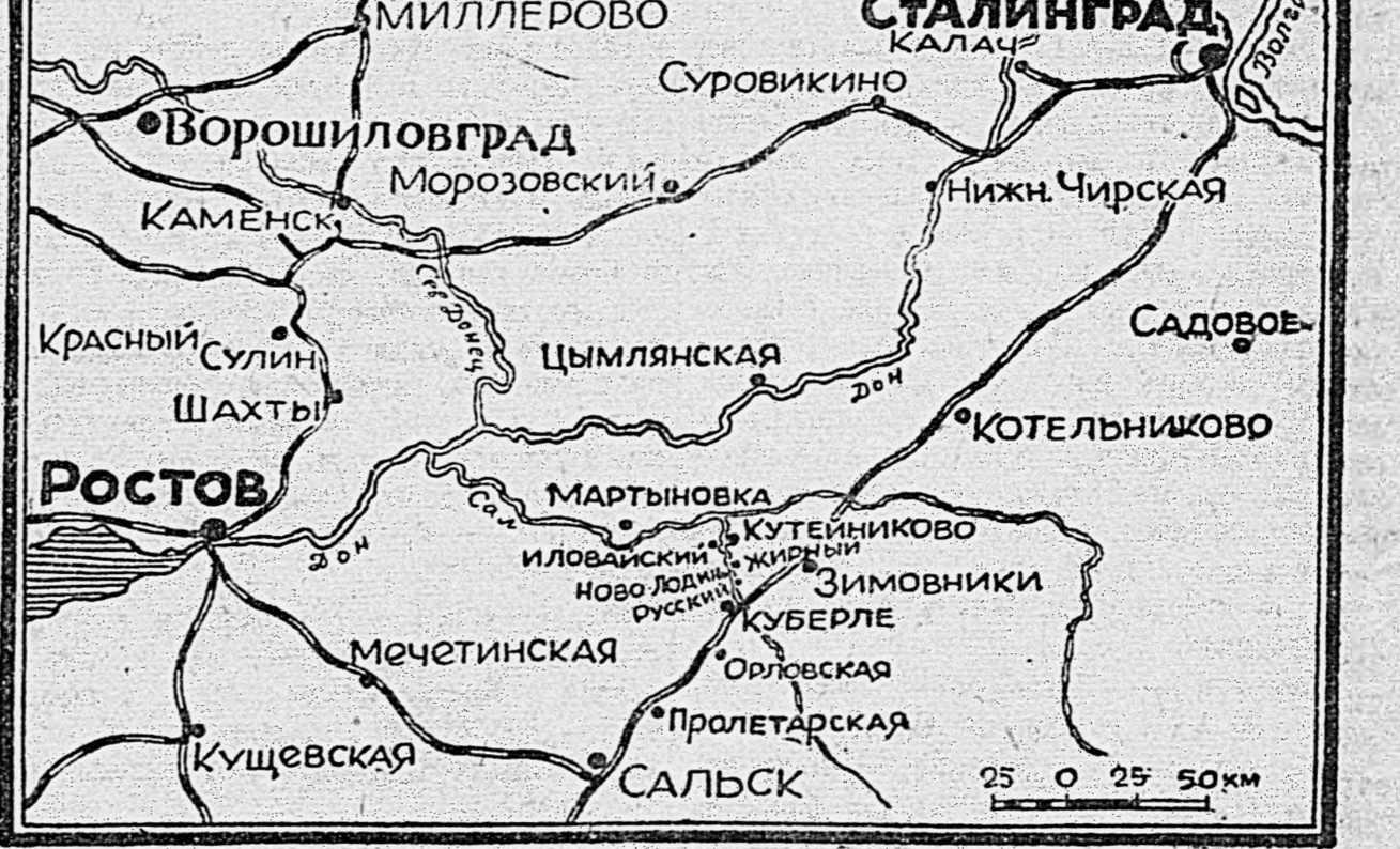
Вит наступление наших войск им не удалось.

В жаркие бои разгорелись в ряде мест на одном водном рубеже, где противник заранее подготовился для обороны и, видимо, намеревался задержать наши наступательные части. Н соединение атаковало ряд насе-