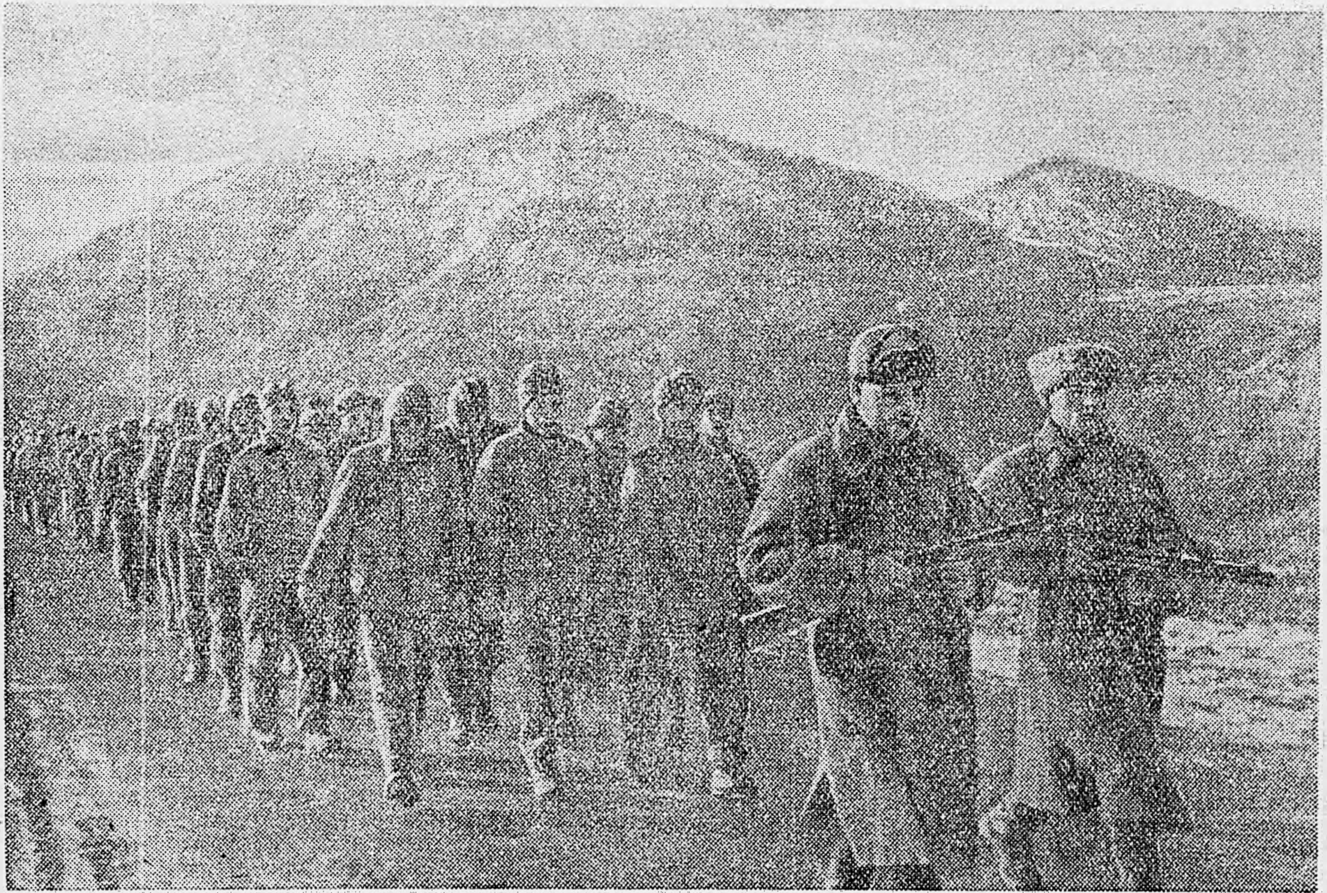
СЕВЕРНЫЙ КАВКАЗ. Немцы, взятые в плен в районе Алагиря.