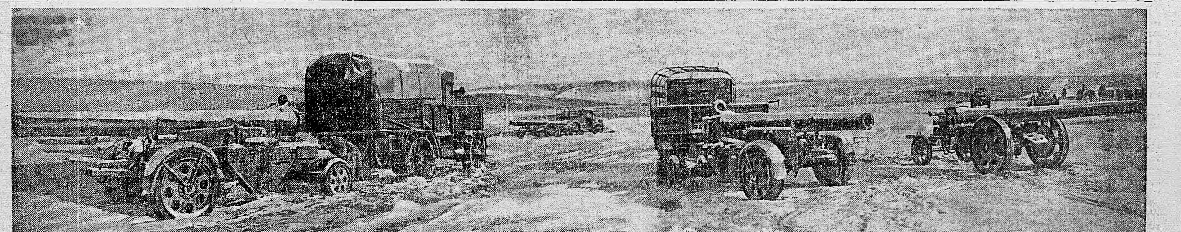
НА СРЕДНЕМ ДОНУ. Севернее Миллерова. Тяжелые немецкие пушки, захваченные нашими войсками.

За пули, что в немцев попали, За гибель нависнувшей тьмы, За то, чтобы немцы пропали, За то, чтобы выгляли мы! За то, чтобы радости снова Вернулись к родным домам, За наших солдаток бедовых, За дочек, за крошек, за мам! За пляски на крепких привалах, За свист подголосков в строю, Давай, заводка, запела, любимую песню свою! Александр ПРОКОФЬЕВ. ЛЕНИНГРАД.