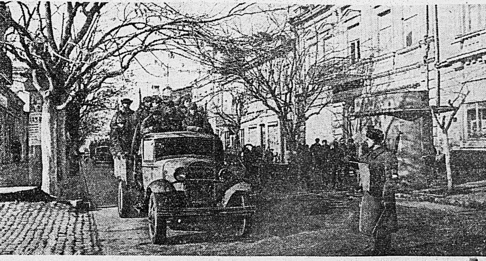
КРЫМ. На снимках: 1. Орудийный расчет подразделения, которым командует лейтенант Осадчий, ведет огонь по немецким войскам. 2. Партизан Б. в разведке. 3. В Керчи. Идет подкрепление на фронт.