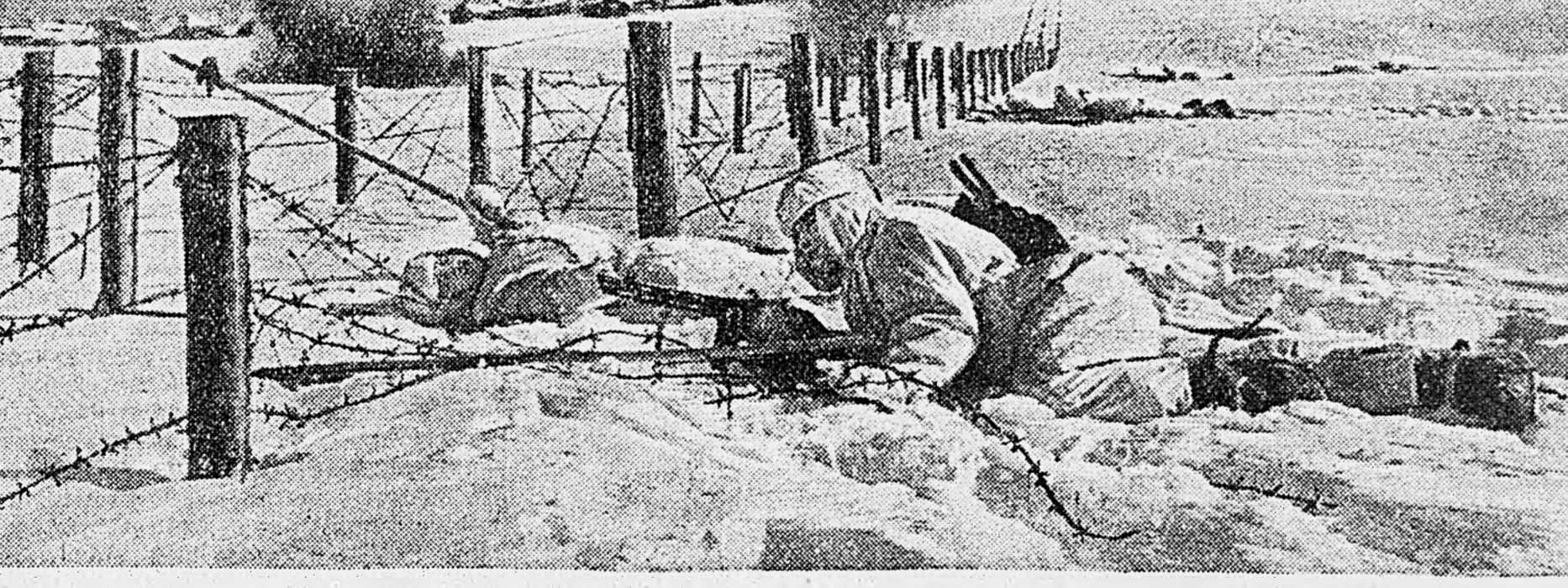
ЗАПАДНЫЙ ФРОНТ, Саперы прорезают в немецких проволочных заграждениях проходы для пехоты.