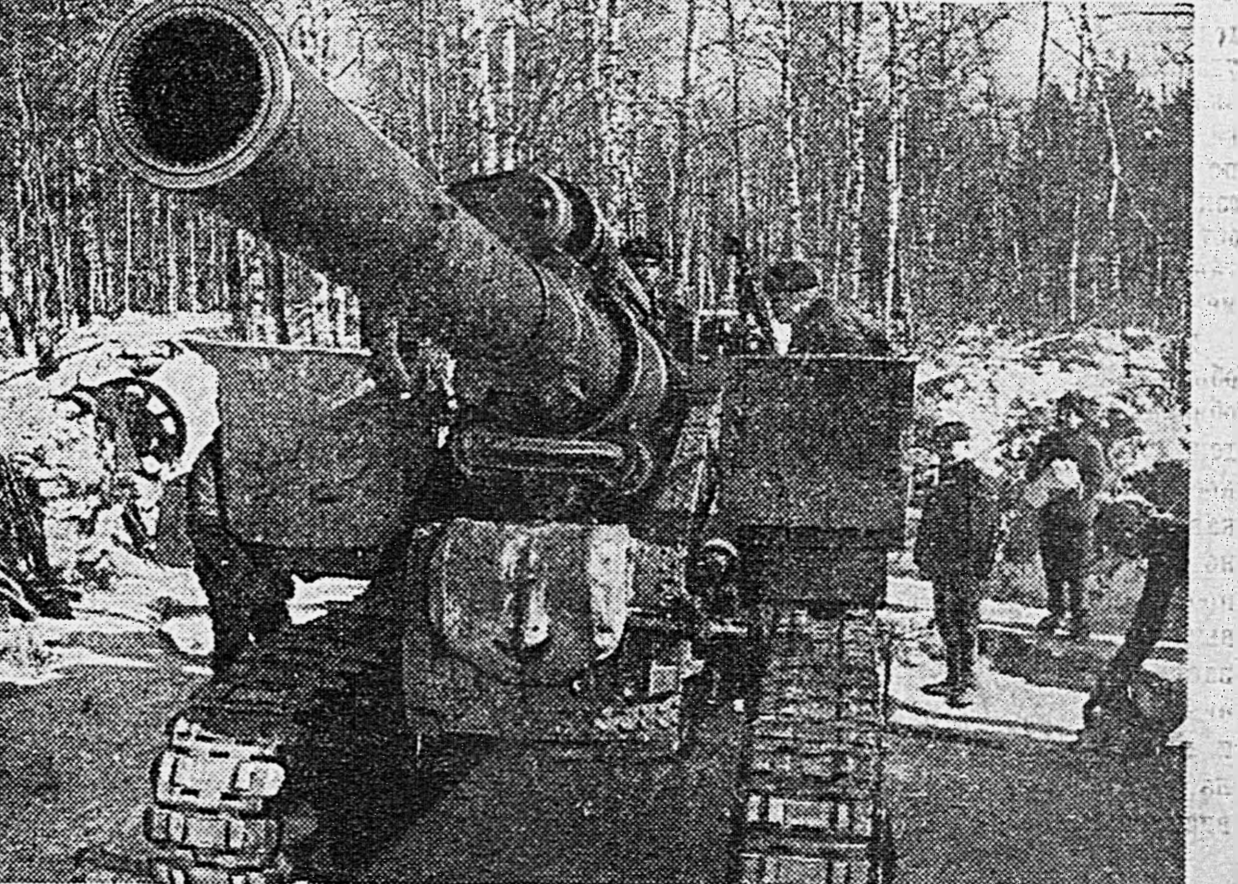
мощности на огневой позиции.