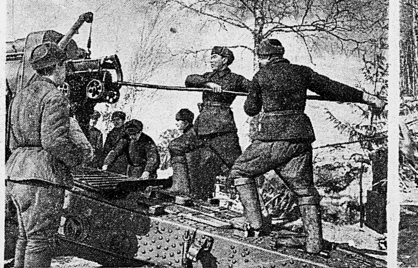
ЗАПАДНЫЙ ФРОНТ. Артиллерия большой