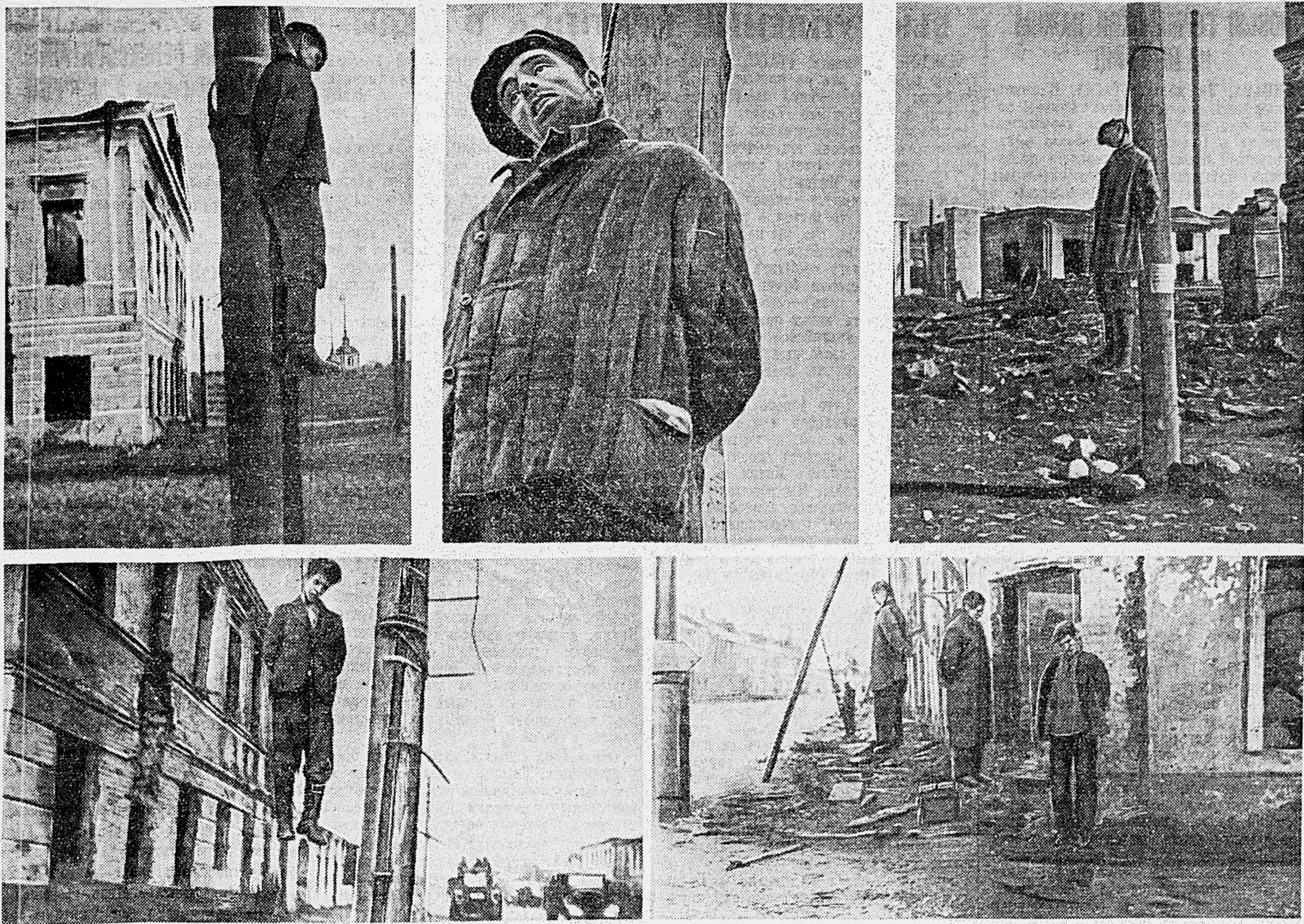
В ОККУПИРОВАННОЙ СТАРОЙ РУССЕ. Мирные жители города, повешенные фашистскими палачами. Фотоснимки найдены у убитого в районе Старой Руссы немецкого унтер-офицера Герхарда Валонка.