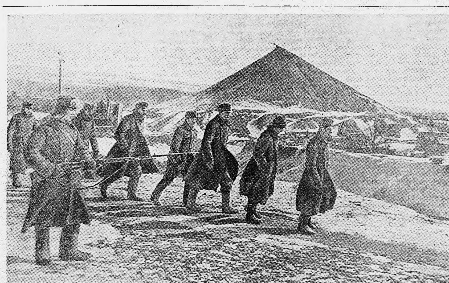
В ДОНБАССЕ. На снимке: группа немецких солдат 457-го пехотного полка 257-й дивизии «Белый медведь», взятых в плен нашими бойцами.