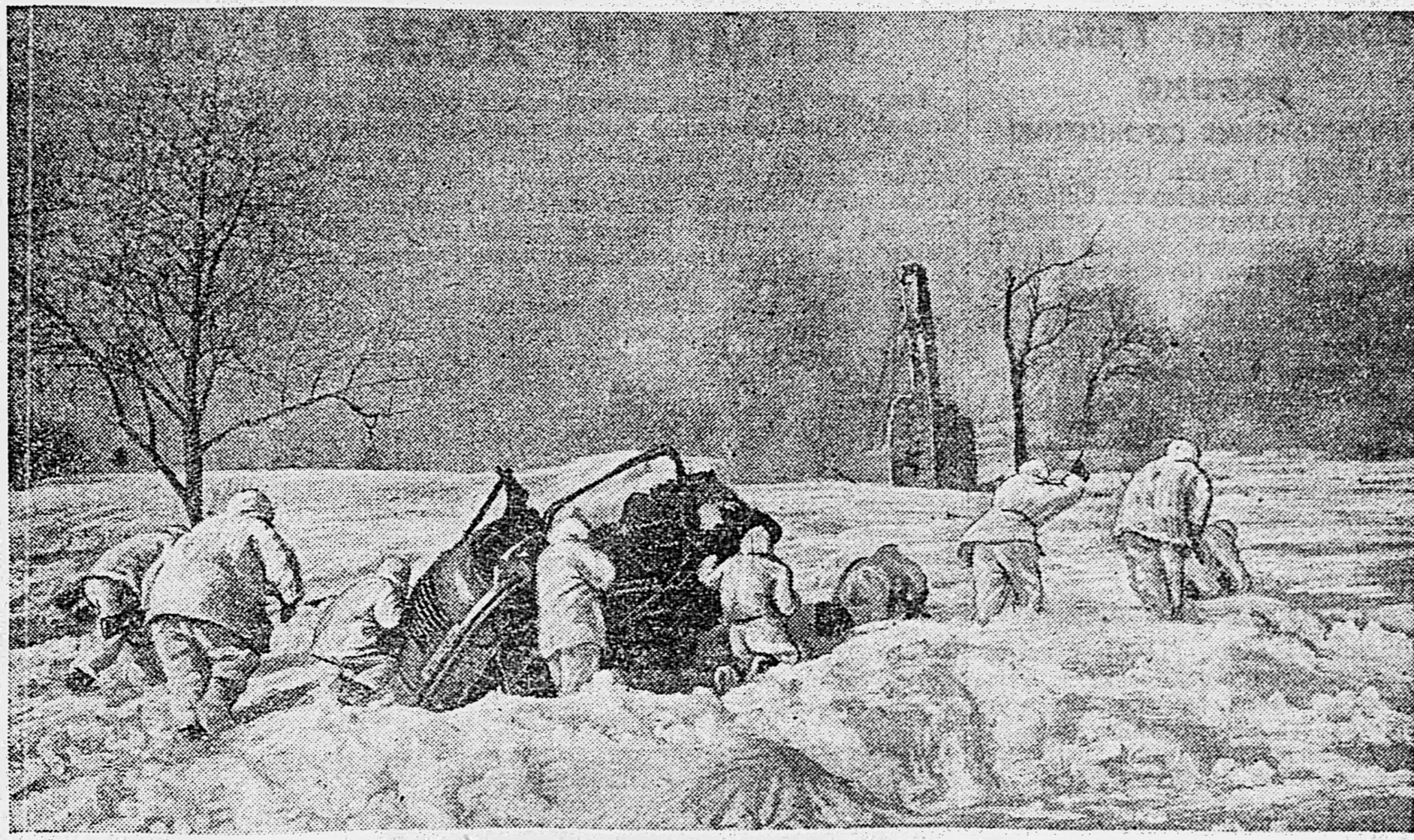
ЗАПАДНЫЙ ФРОНТ. Подразделение под командой старшего лейтенанта Корягина выбивает врага из населенного пункта.