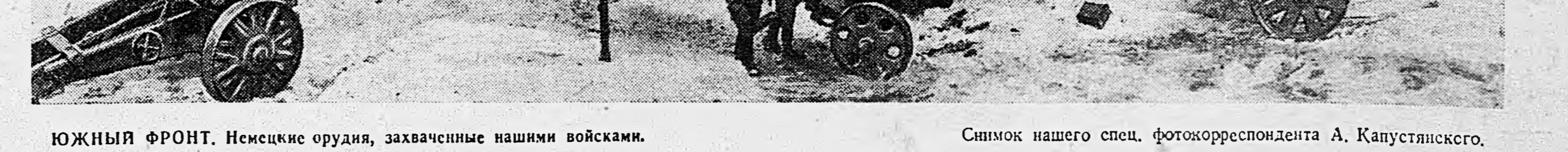
ЮЖНЫЙ ФРОНТ. Немецкие орудия, захваченные нашими войсками.

Вчера, 20 марта, заместителем Председателя Президиума Верховного Совета СССР тов. А. Е. Бадаев вручил ордена и медали награжденным.