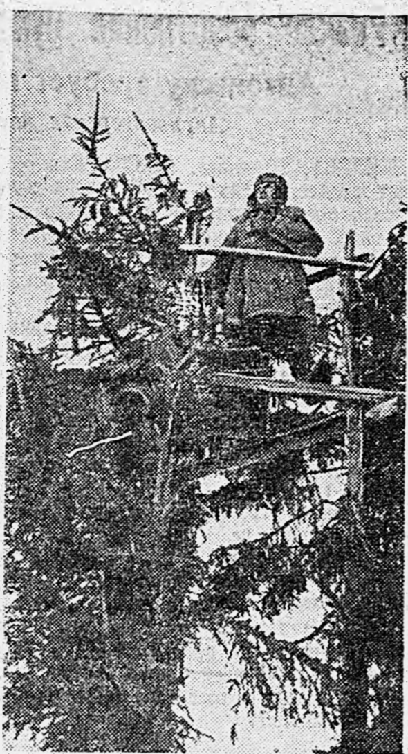
СЕВЕРО-ЗАПАДНЫЙ ФРОНТ. Наблюдательный пост зенитчиков-артиллеристов.

сроки аренды которых истек в 1941 г. 2. Японское Правительство дало согласие на уплату установленной соглашением 1941 г. 20 проц. надбавки ко всем платежам, причитающимся с японских рыбопромышленников в качестве арендной платы и плавающих налогов и сборов. Эта дополнительная сумма уплачивается сверх увеличения арендной платы на 10 проц. в соответствии с порядком, установленным на основании обмена нот от 2 апреля 1939 г., за те рыболовные участки, которые будут заторгованы японскими рыбопромышленниками на торгах 1942 г. 3. Ввиду изменения условия расчета по аренде рыболовных участков, Японское Правительство согласилось производить платежи по требованию Госбанка СССР в золоте в слитках по слачей вышеуказанного золота во Владивостоке или в иностранной валюте по выбору Госбанка СССР. 4. Японское Правительство также согласилось, чтобы японские рыбопромышленники при внесении арендной платы в золоте дополнительно уплатили Советскому Правительству сумму в размере 4 проц. на покрытие расходов по перевозке золота. (ТАСС).