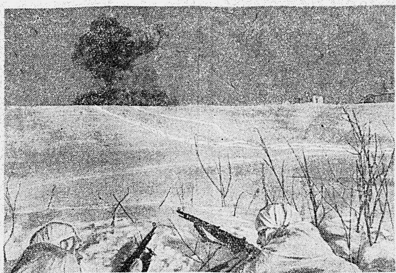
снимках: 1. Саперы ползут к дзоту. 2. Дзот взрывается. 3. Пехота идет в атаку.